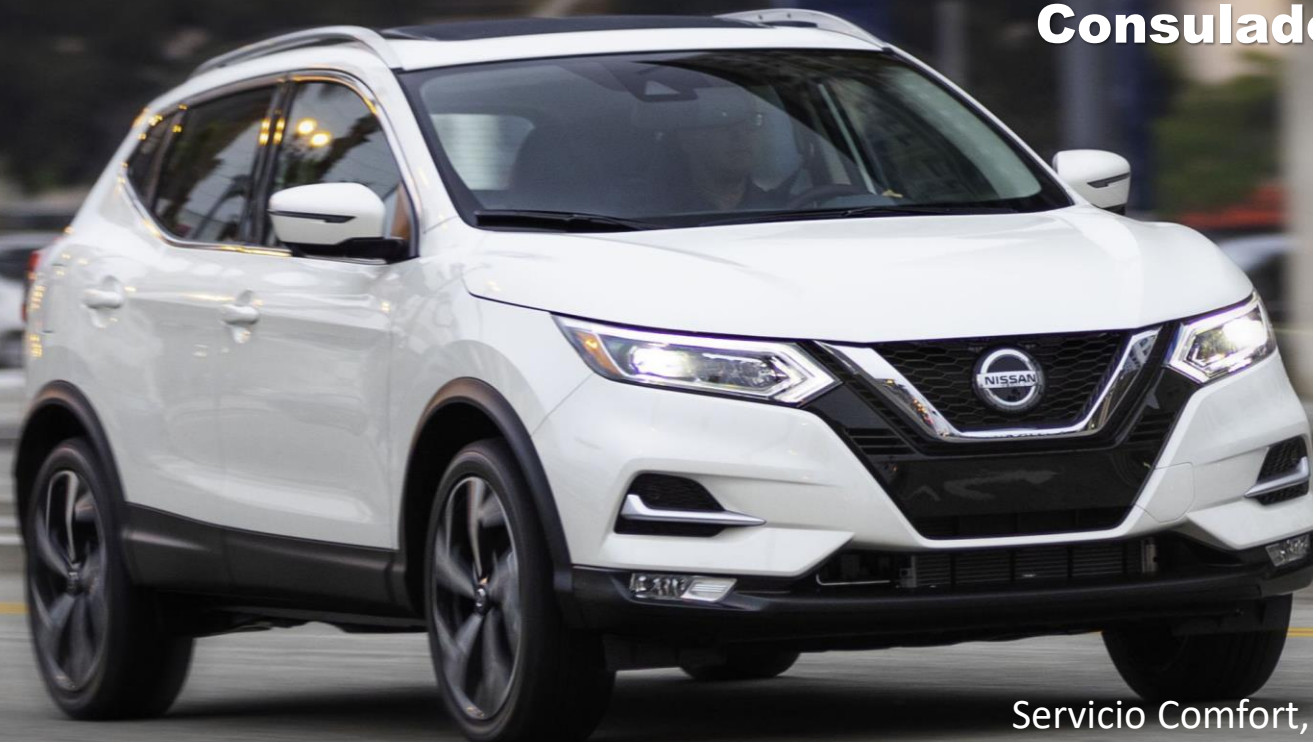
Servicio Comfort, SUV Nissan Rogue Sport

Aeropuerto, Corte, Inmigración, Oficina de Abogados, Consulado, Turismo.