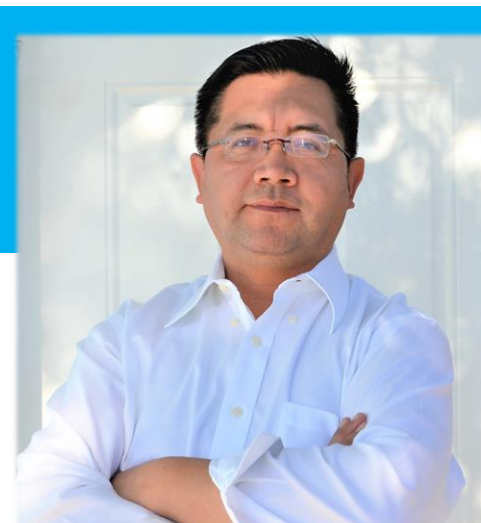
Por: William Delgado Gil @WilliamDelgadoG

¡Feliz Navidad y un muy bendecido Año 2022!