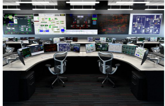
غرف العمليات والسيطرة