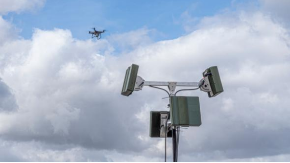
مكافحة الطائرات المسييرة (مضادة للطائرات بدون طيار)