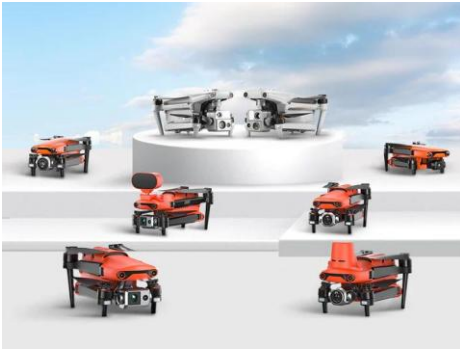
الطائرات المسييرة العسكرية والتجارية