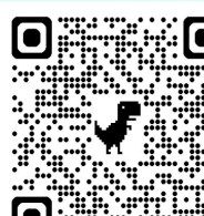
FORM A & B

At the bottom of the registration form, parents "Agree" that their registration is NOT complete unless they sign