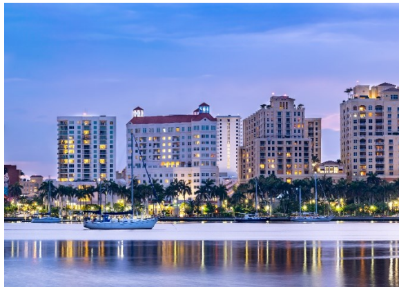
West Palm Beach