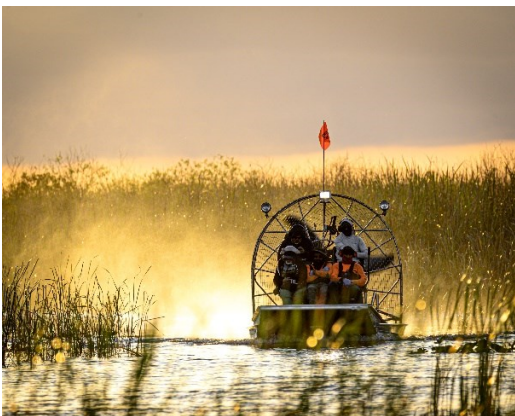
Airboat tour - Everglades

4° Giorno KEY WEST - EVERGLADES - WEST PALM BEACH. Primo pasto della giornata gustando crepes, omelette e molto altro, tutto rigorosamente homemade. Viaggeremo a stomaco pieno per circa 150 miglia per raggiungere le Everglades , il cuore selvaggio della Florida meridionale, con un safari in airboat tra gli alligatori, ammirando la particolare fauna locale. Ci dirigeremo al "City Place" di "Rosemary Square", parte integrante di West Palm Beach, sempre affollato di gente soprattutto di sera, con oltre 60 ristoranti e negozi aperti fino a notte fonda, musica dal vivo, cinema e bowling. Fantastica atmosfera! Cena a base di hamburger in pieno stile americano.