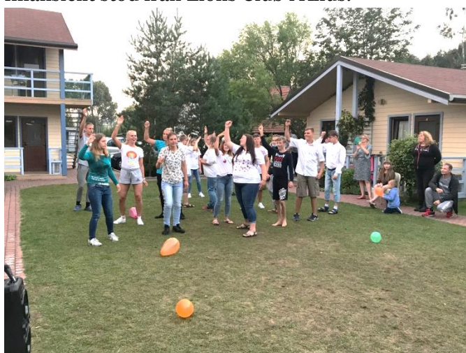
Sommarkolonin "Den lilla ljusstrålen"

Detta år var mycket anorlunda för vårt samhälle och för vår ideella verksamhet. Pandemin och karantän i Litauen har begränsat vår verksamhet men tack vare våra aktiva medlemmar och bra stöd från kunder som kommer till oss för att handla eller lämna saker lyckades vi med att samla och skicka iväg fyra stora och fyra mindre hjälpsändningar och organisera två sommarkolonier för barn och en sommarkoloni för pensionärer. Den efterlängtrade sommarkolonin "Den lilla ljusstrålen" för funktionsnedsatta barn från Siauliai har som vanligt genomförts tack vare finansiellt stöd från Lions Club i Åhus.