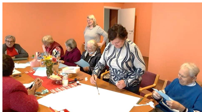
Sommarkoloni för pensionärer i Ukrainai by