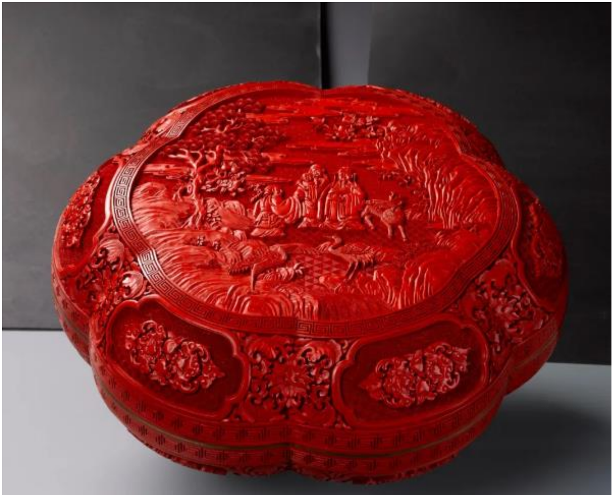
《三星贺寿剔红捧盒》

各异，海浪翻腾、岩石激浪、波涛遒劲，呈现出一派欢腾浩瀚的场面。龙的神态威猛，雕工精妙，运刀流畅。