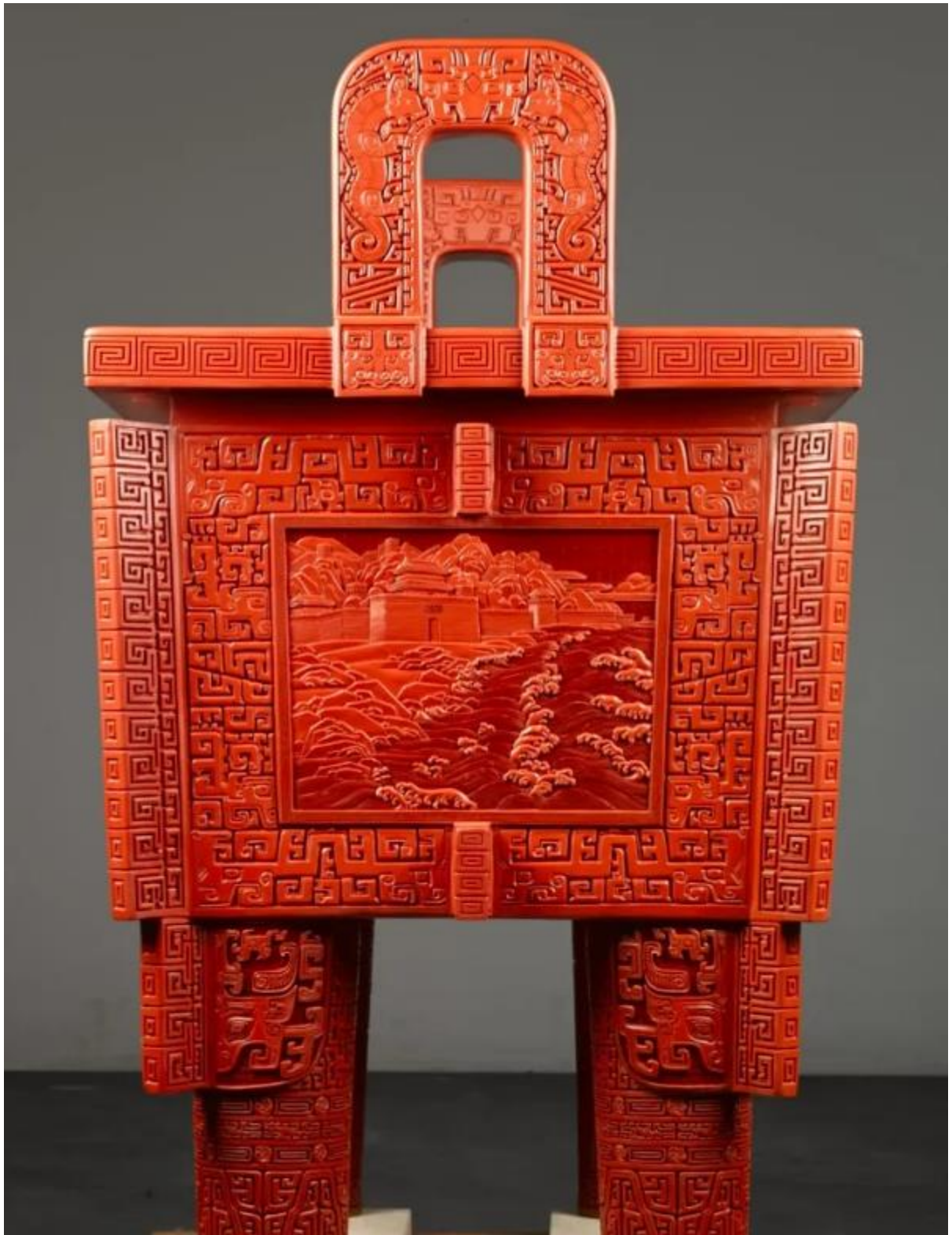
《锦绣中华大鼎》侧面