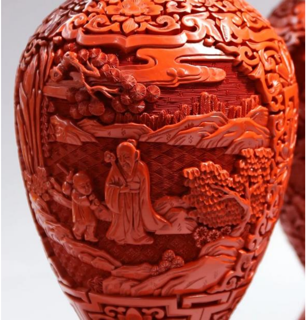
《访友图雕漆仿瓷瓶》局部

作品胎体厚重，造型端庄秀美，髹漆肥厚，雕刻精致。表现了一老者和童子在风和日丽的秋季，在山野间巡游的场景，反映出古代先贤，超脱、飘逸、闲适的生活情趣。