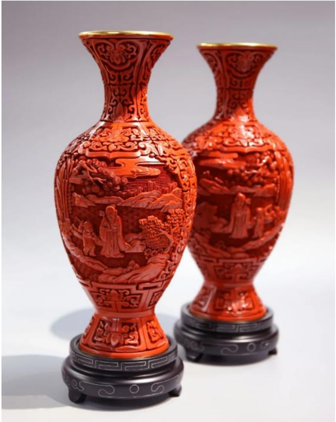
《访友图雕漆仿瓷瓶》