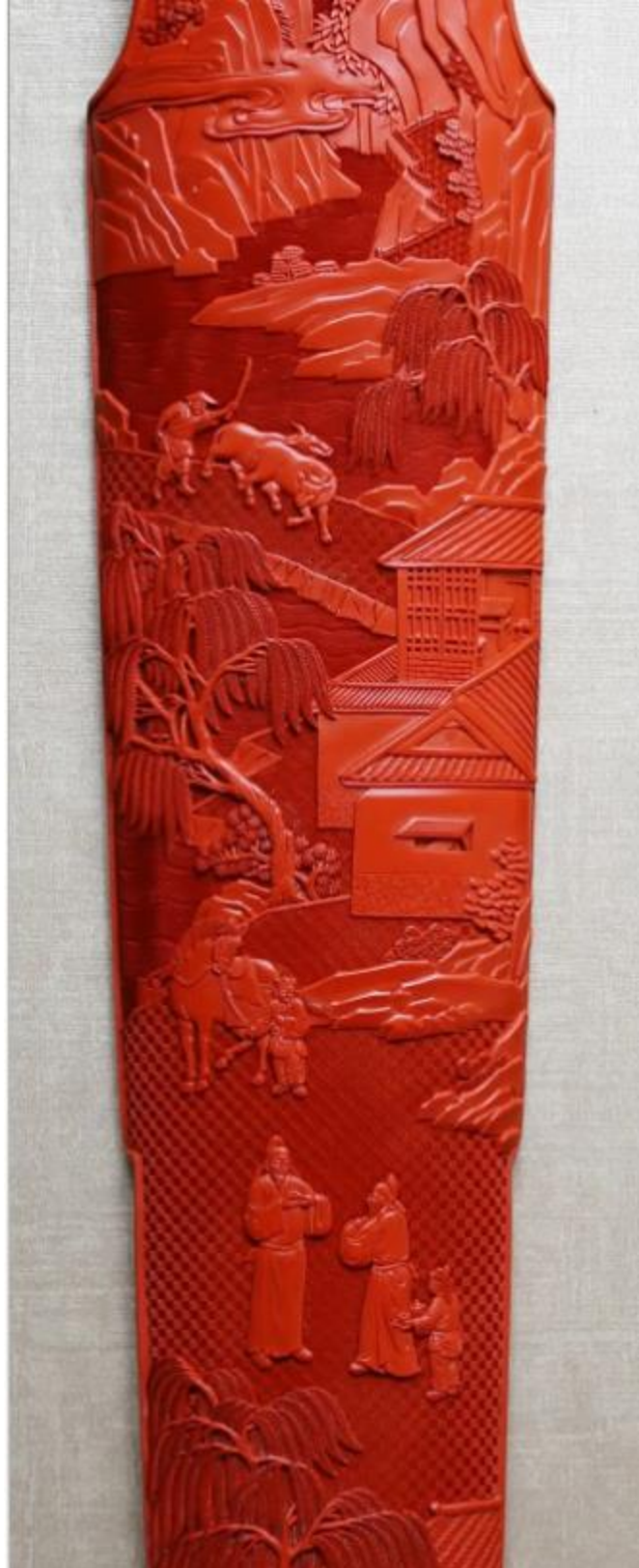
《古琴四曲挂屏》局部