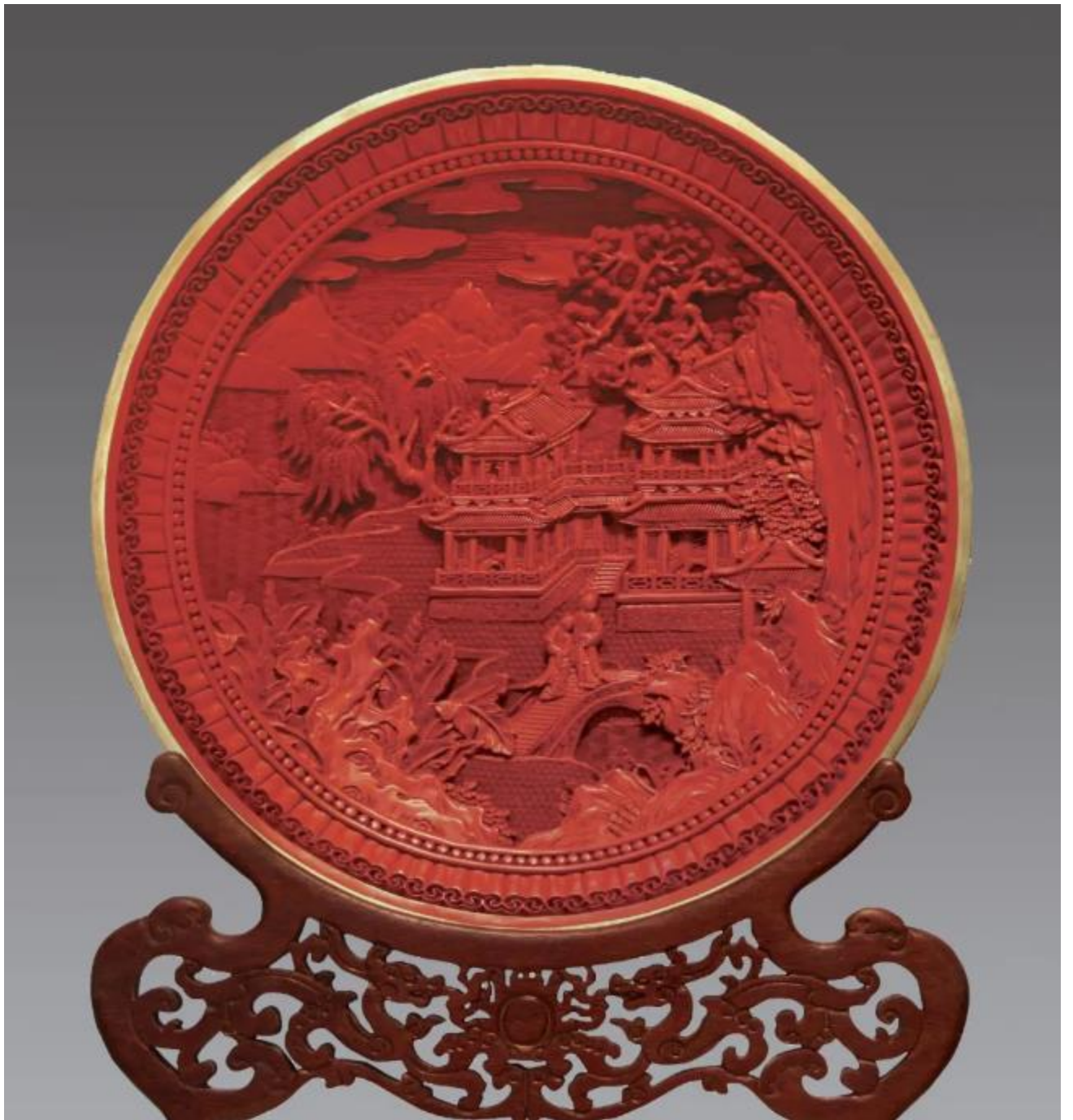
《风景人物圆盘》 | 制作者：宋秀珍