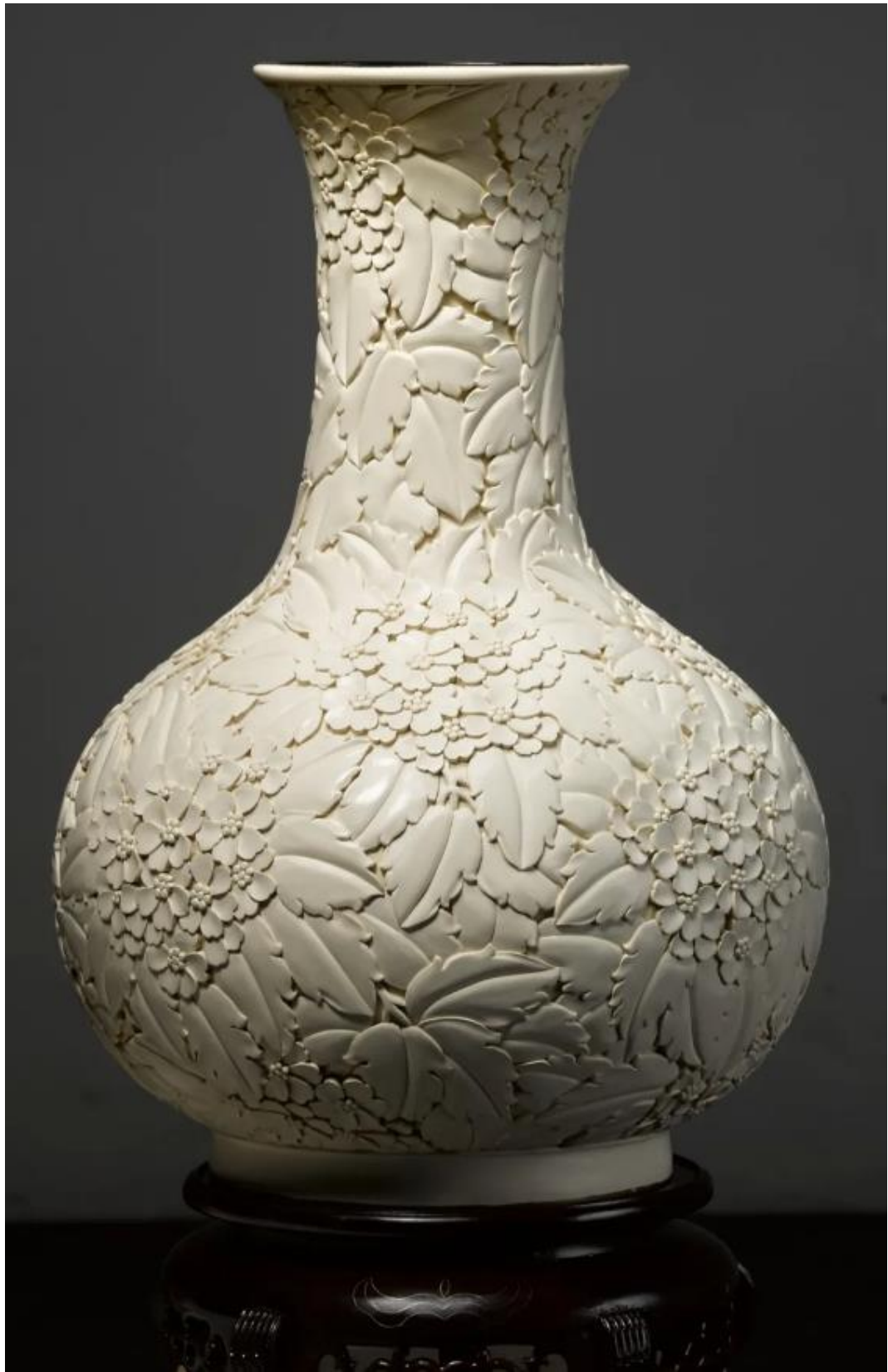
《白漆海棠瓶》 | 制作者：王慧茹