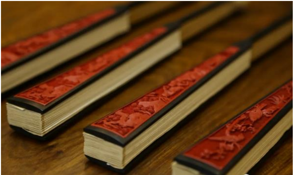
《传统剔红工艺折扇》 雕漆制作：殷秀云

作品以中国古琴造型之伏羲和仲尼二式为挂屏外形，并选四支古琴曲《高山流水》《阳光三叠》《汉宫秋月》《昭君出塞》为创作题材，以深入细腻的手法表现了古代文人、诗人的情怀和女性无奈的命运。作品以景以物抒情，扣和了古琴曲的优美曲调，构图丰富、精美，雕刻细腻、生动；整套作品从外形到内容达到了和谐完美的统一性。此作品为2016年“工美杯”北京传统工艺美术大赛金奖、珍品奖作品。