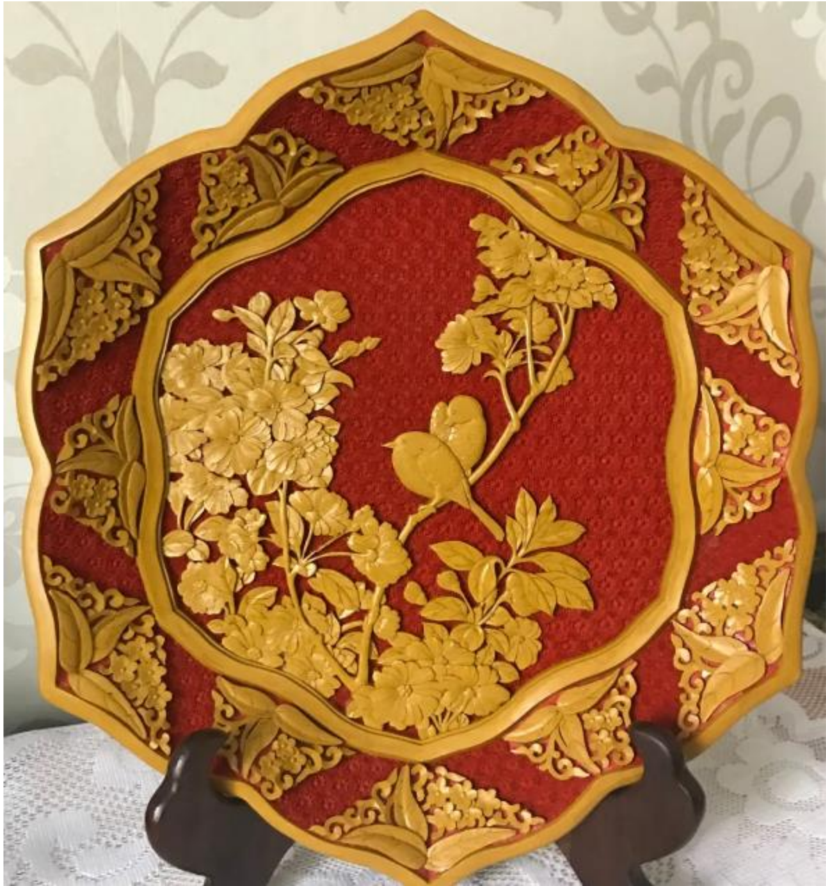
《海棠山雀剔黄六角盘》