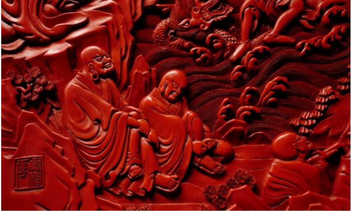
图片《十八罗汉圆盘》局部

作品正面图案取材佛经故事。十八罗汉为释迦牟尼护法弘佛的弟子，他们取得修行者的最高果位，已除尽一切烦恼和疑惑，证得涅槃，得到解脱。险峻嶙峋的山涧内，上露一线天，山洞深幽、草木繁茂、潭水湍急，烘托出十八个人物的生动形象。作品雕刻精美细腻，人物表情尤为生动传神。雕刻时间约4个月，创作于2007年初，获2008年中国传统工艺美术精品展金奖。