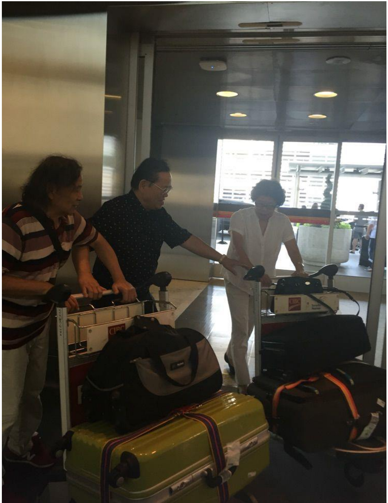
8月29日抵达多伦多皮尔逊机场