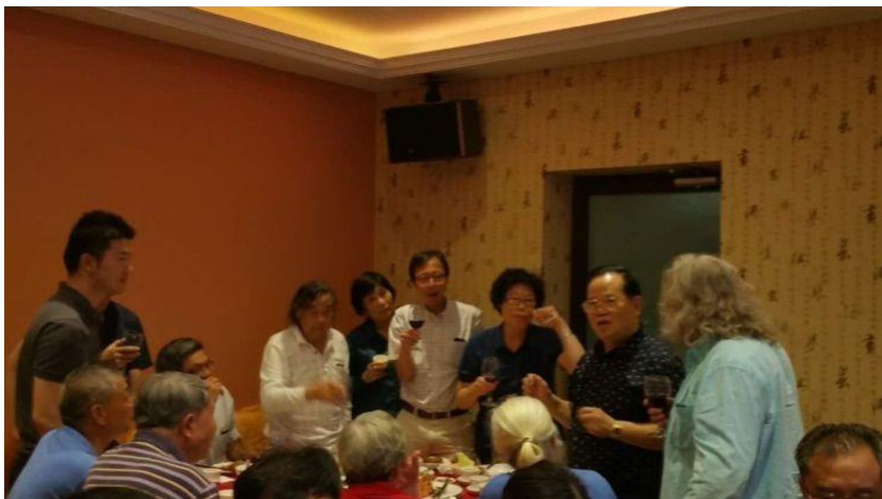
9月6日晚藏友们的饯行晚宴