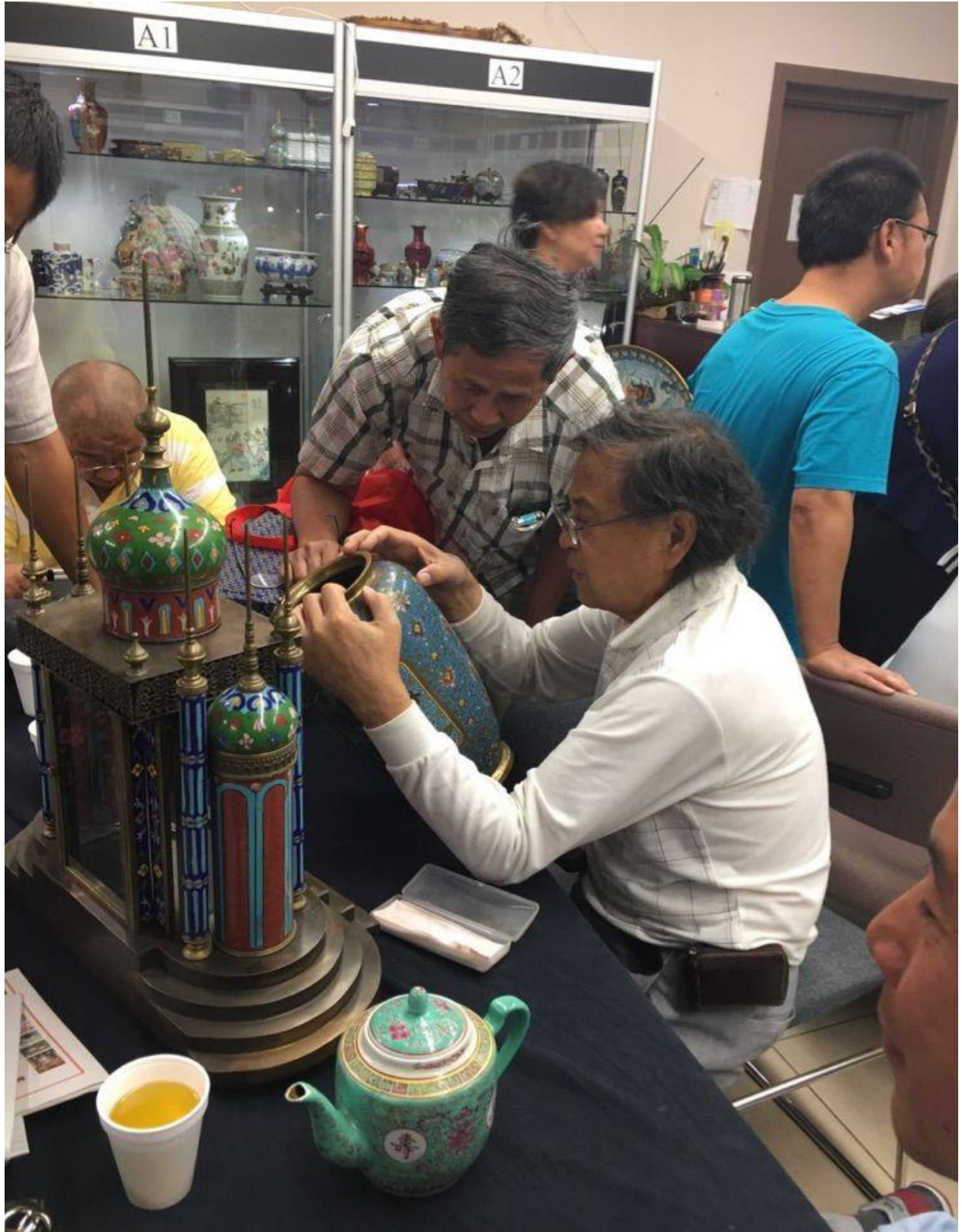
为本地景泰蓝藏友鉴定