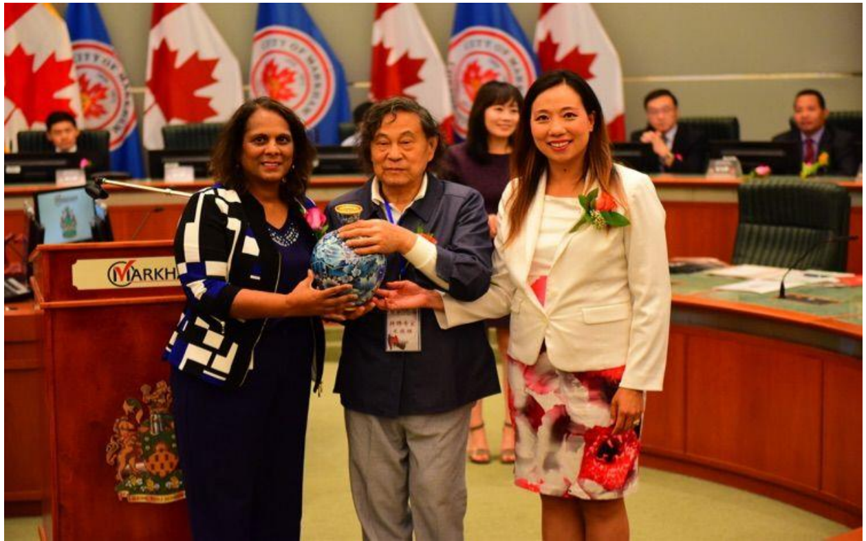
米大师将自己亲手精制的“繁荣昌盛”景泰蓝花瓶赠送万锦市政府