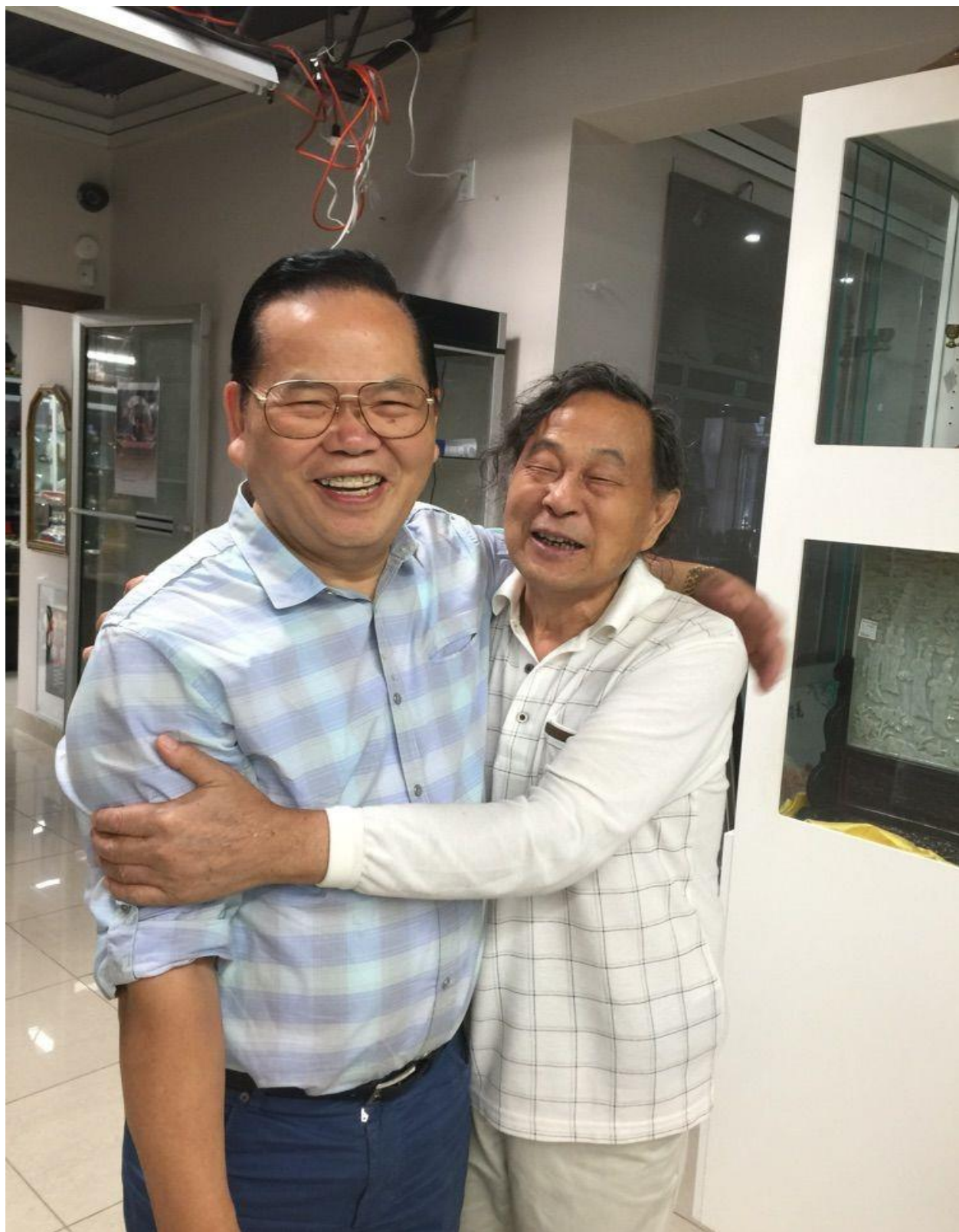
与老米粉亲密相拥