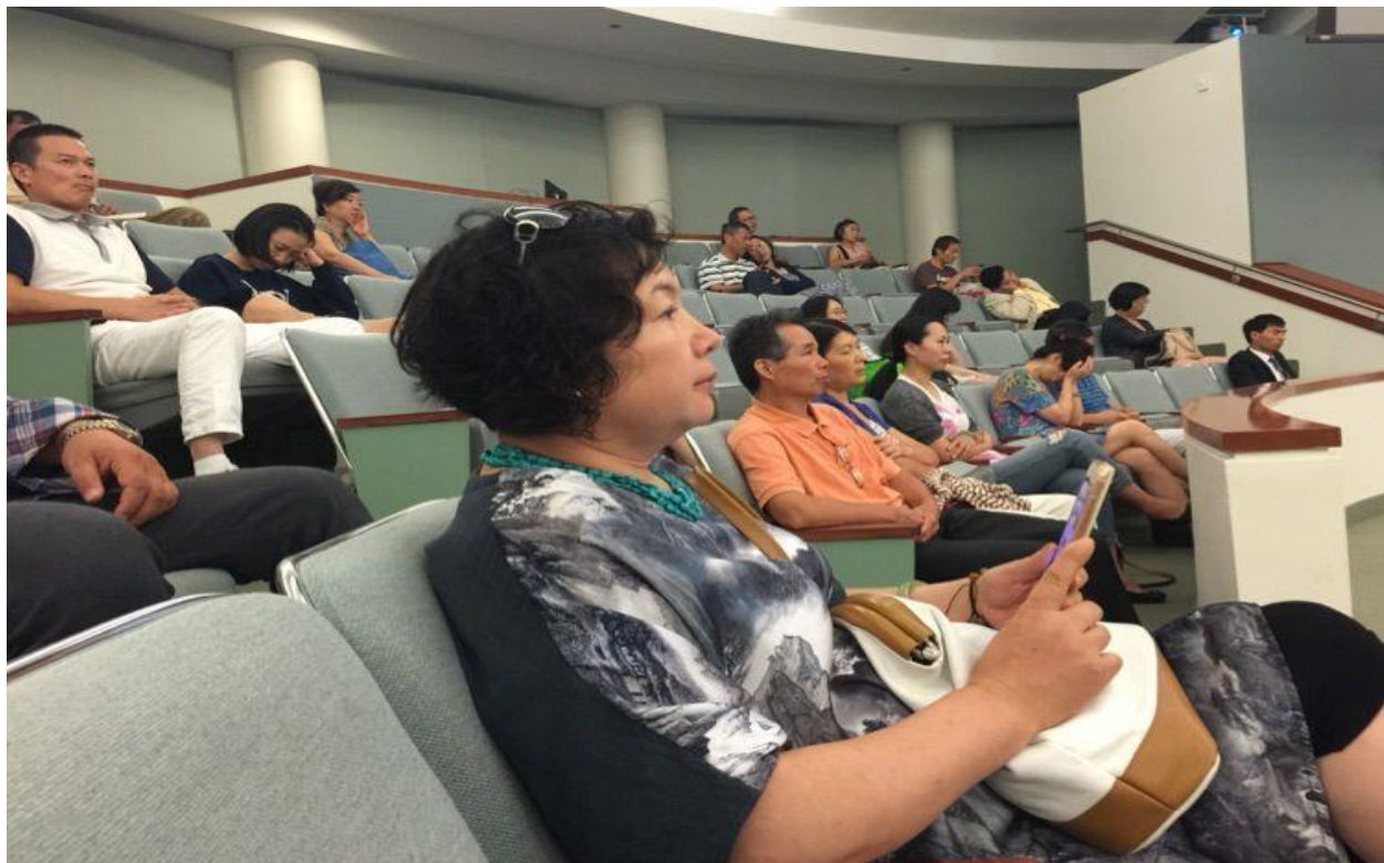
艺术节期间在万锦市政府市长议政厅为本地艺术爱好者进行题为《景泰蓝：北京的特产、首都的名片》的精彩讲座