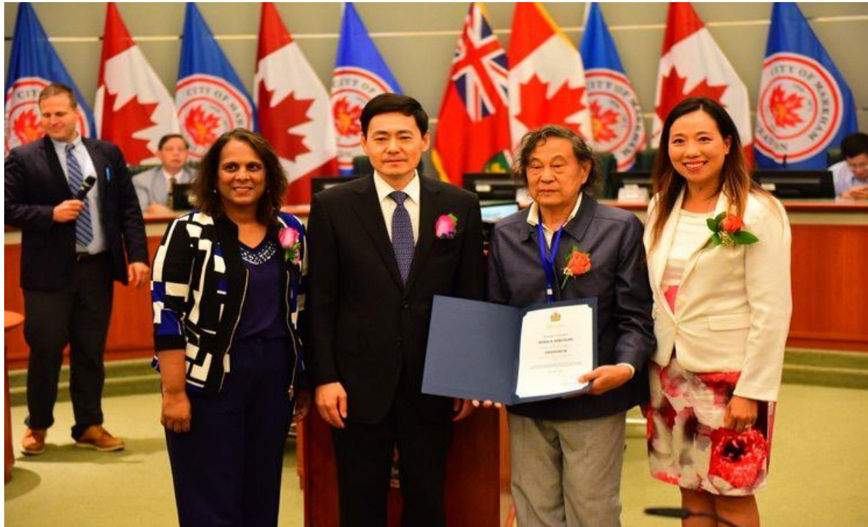
接受由中国驻多伦多总领事薛斌和万锦市议员颁发的万锦市政府的感谢状