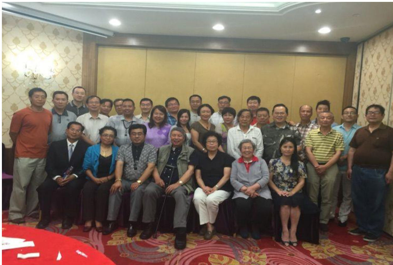
到多伦多后热情的藏友为大师接风