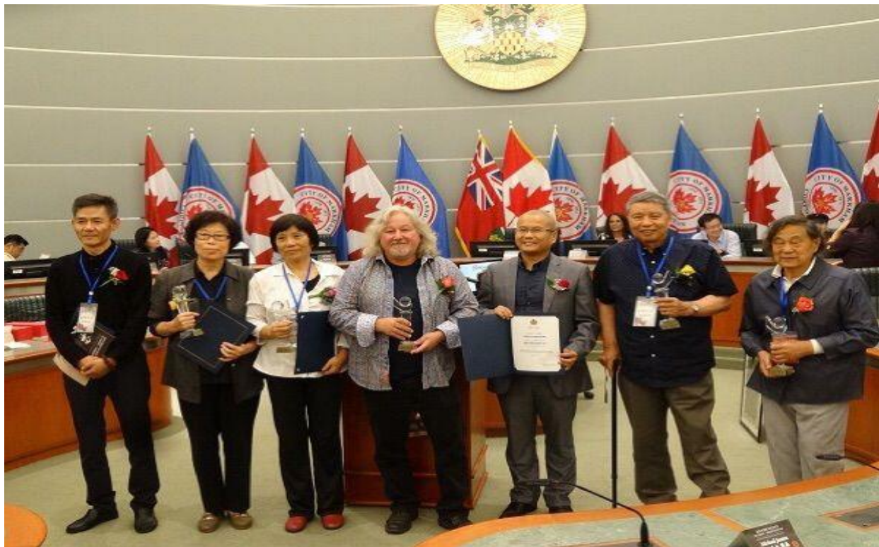
与艺术节全体专家一起