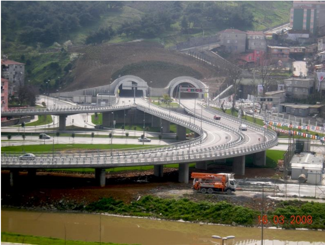
7 TEPE - 7TÜNEL PROJESİ KAĞITHANE ÇIKIŞI KÖPRÜLÜ KAVŞAK PROJESİ - ISTANBUL Mart-2009

Bağdat Cad. Adatepe İş Mrk. No:276/21-22 Maltepe/İSTANBUL www.eproeng.com