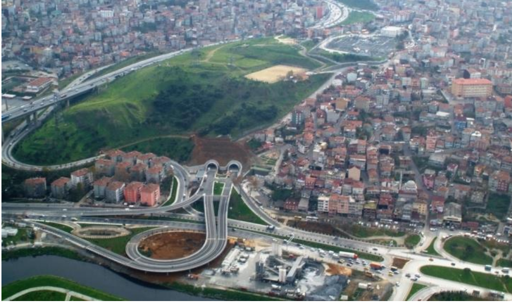
7 TEPE-7TÜNEL PROJESİ KAĞITHANE ÇIKIŞI KÖPRÜLÜ KAVŞAK PROJESİ - ISTANBUL Mart-2009

MÜHENDİSLİK BİLGİ İŞLEM İNŞAAT TURİZM ve DANIŞMANLIK SANAYİ ve TİCARET LTD. ŞTİ.