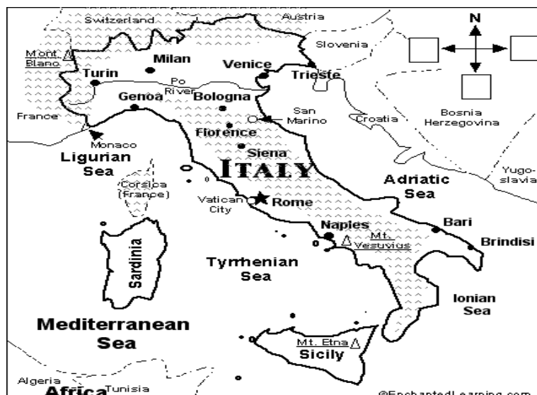
Larawan 1.1. Mapa ng Italy https://tinyurl.com/y2ljvnd3

B. PANUTO: Suriin ang mapa ng Kabihasanang Romano. Magagamit itong gabay sa mga susunod na talakayan.