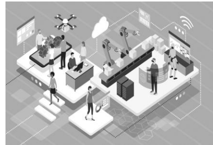
Pinagkunan: Viewsonic. Technology in Factory https://tinyurl.com/y54dca4w on 06.30.20

Pinagkunan: Creative Commons Industrial Worker Icons https://tinyurl.com/y36uerlb on 06.30.20