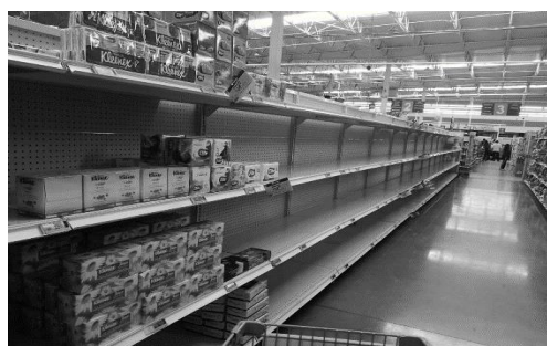
Panic buying https://tinyurl.com/y5s4674q on 06.20.2020

Halimbawa, may paparating na bagyo na tatama sa Gitnang Luzon na isa sa mga pinagmulan ng supply ng bigas sa bansa. May ilang mapagsamantalang negosyante na magtatago ng kanilang supply dahil sa inaasahang pagtaas ng presyo ng produkto. Kapag nangyari na ang inaasahang pagtaas ng presyo ng bigas, muli nilang ilalabas sa pamilihan ang mga itinagong bigas. Ang Cartel o Kartel ay nakita sa pakikipagsabawatan ng mga malalaking negosyante (firms) upang higpitan ang suplay sa pamamagitan ng paghawak ng suplay ng produkto kaya nadidiktahan nito ang galaw ng presyo ng produkto.