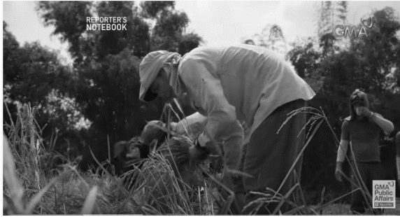
Pinagkunan: GMA Public Affairs. “Reporter’s Notebook: Huling Ani” Youtube video, 10:39. September 26, 2019. https://www.youtube.com/watch?v=UpvW0UntErY

Panuto: Panuorin ang maikling dokumentaryo ng Reporter’s Notebook at Brigada tungkol sa sitwasyon ng mga magsasaka sa ilalim ng bagong ipinasang batas na Rice Tarrification Bill Law noong 2019. At sagutin ang mga gabay na tanong sa ibaba.