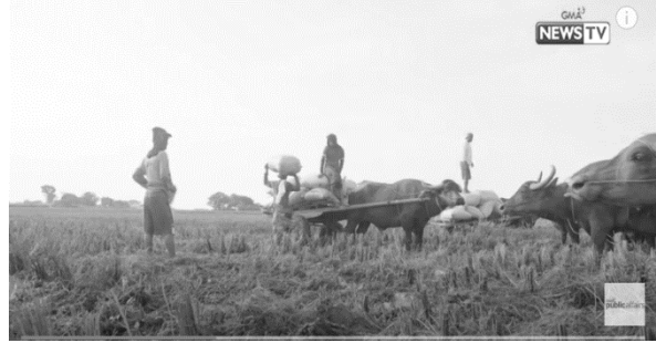
Pinagkunan: GMA Public Affairs. “Brigada: Ilang magsasaka, napaaray sa Rice Tariffication Law!” Youtube video, 13:31. September 25, 2019. https://www.youtube.com/watch?v=mJTgcmNNH7U