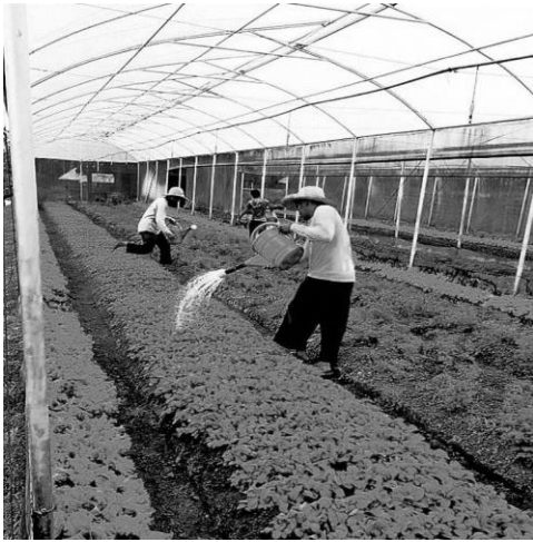
Farming https://tinyurl.com/y3gms6ne on 06.20.2020