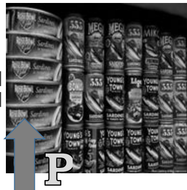
Presyon ng Sardinas tataas ng P1 - DTI https://tinyurl.com/y6go8ahv on 06.20.2020