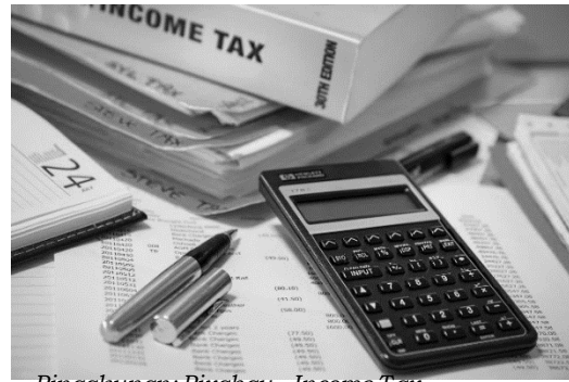
Income Tax https://tinyurl.com/y4zgmj8b on 06.20.2020

Repleksyon: Paano naging mahalaga ang mga sumusunod na salik para sa matalino pagpili ng mga supplier?