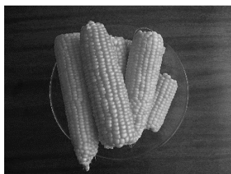
Corn. https://tinyurl.com/y3hluf7z on 06.20.2020

Ang mga pagbabago sa presyo ng isang produkto ay nakakaapekto sa quantity supplied ng mga produktong kaugnay nito. Halimbawa, ang mga magsasaka ay nagtatanim ng palay at mais. Sa panahon na mas mataas ang presyo ng mais, magaganyak siyang gamitin ang kabuuang lupa bilang taniman ng mais. Ito ay magdudulot ng pagbaba ng supply ng bigas at pagtaas ng supply ng mais.