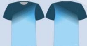
CAMISETA DRY MANGA CURTA