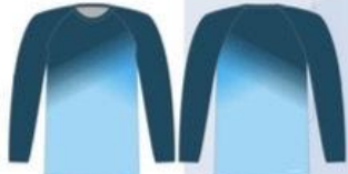
CAMISETA UV MANGA LONGA