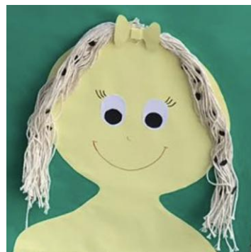
Figura 02. Fotografia do cartaz confeccionado pelos discentes representando uma boneca de papel com "piolhos".

lesões no couro cabeludo, agitação e menor rendimento escolar. Posteriormente, iniciamos uma conversa dinâmica com as crianças e as convidamos para participar ativamente da discussão sobre a prevenção e o tratamento dessa doença, bem como sobre a prática de outras medidas fundamentais de higiene pessoal que poderiam ser realizadas diariamente, pois queríamos entender quais as concepções iniciais que elas traziam sobre o assunto. Ademais, um material educativo confeccionado pelos(as) discentes foi entregue para os(as) alunos(as) para que eles(as) pudessem colorir, aprender e mostrá-los para os familiares e responsáveis, de modo que o cuidado relacionado à higiene também fosse compartilhado. Sendo assim, durante essa experiência percebemos, na prática, a grande importância da Educação Popular em Saúde ao proporcionar alternativas de mudanças da realidade social, pois a partir da criação de novos horizontes para a construção de processos de aprendizagem, os próprios indivíduos evidenciaram as demandas mais necessárias e tornaram-se verdadeiros protagonistas no processo de cuidado e do bem-estar.