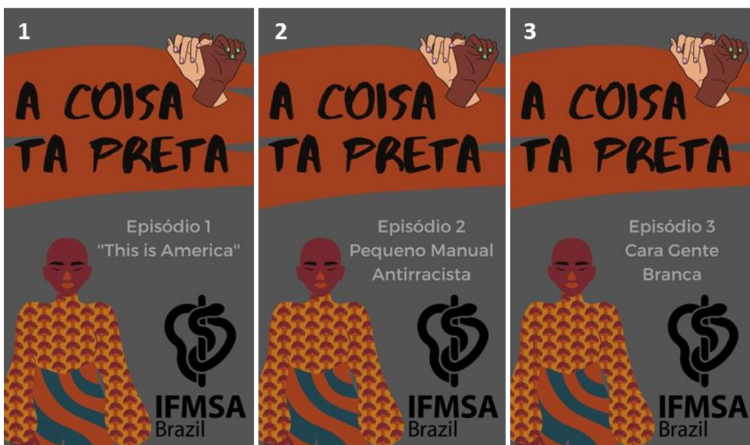
Figuras 1, 2 e 3. Cartazes do primeiro, segundo e terceiro episódios do projeto “A Coisa Tá Preta”, respectivamente.

Posteriormente, o cenário da experiência foi realizado na plataforma social do Instagram da IFMSA, na qual os curtas foram divulgados quinzenalmente, junto aos cartazes criados para conferir identidade ao projeto (Figuras 1-3).