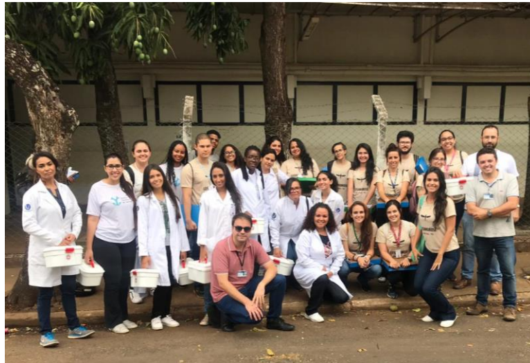
Figura 1. Equipe de pesquisadores do projeto

enfermagem, fisioterapia, medicina veterinária e curso técnico de análises clínicas] coordenados por três docentes da UFU. Duas pesquisadoras foram bolsistas do projeto de extensão e relatam nesse material os principais pontos de aprendizado (Figura 1).