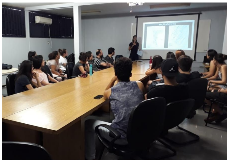
Figura 3. Primeiro dia de treinamento da equipe