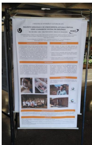
Figura 3. Exposição do banner em Mostra Científica da UFU