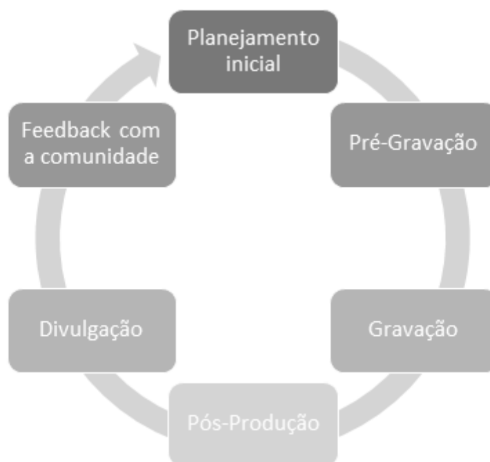
Figura 1. Etapas do processo criativo