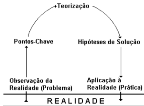
Figura 01. Representação do Arco de Maguerz

ativa de ensino-aprendizagem que tem por objetivo problematizar a realidade em busca de intervenções que apliquem os conhecimentos adquiridos em campo e na literatura para alcançar a transformação do problema encontrado inicialmente. Dessa forma, o método é dividido nas seguintes etapas: observação da realidade e definição do problema, identificação dos seus pontos-chave, teorização para buscar possíveis caminhos para a resolução da questão inicial, criação de hipóteses de solução e aplicação à realidade (COLOMBO, 2007). Assim, as ações desenvolvidas em cada escola eram construídas segundo seus diferentes contextos e participações de seus atores sociais, de forma horizontal e dialógica. Após a construção do Arco com as problemáticas levantadas no primeiro dia, os grupos organizaram as atividades a serem desenvolvidas no próximo encontro.