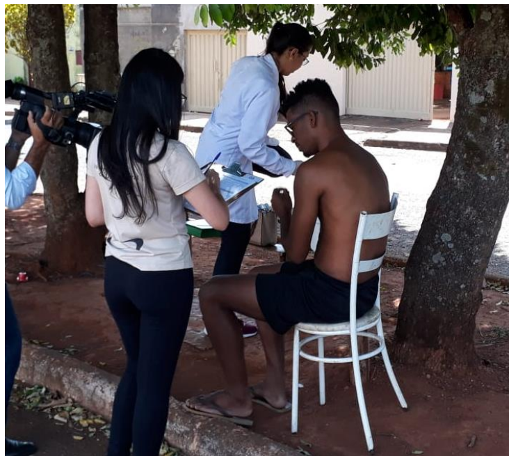
Figura 2. Dupla composta por um coletor e um entrevistador