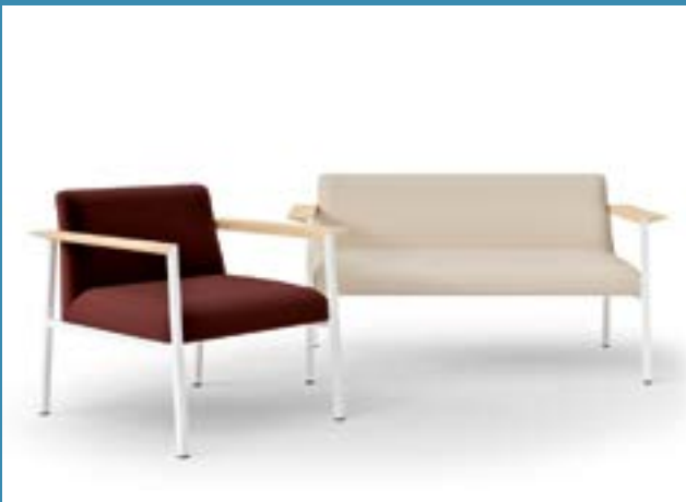
Lounge and conference chairs