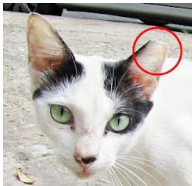
Figura1. Modelo/padrão marcação externa internacional