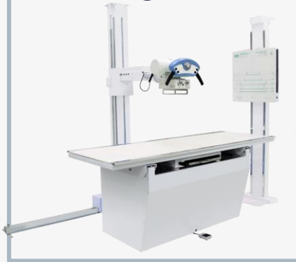
DIAFIX HF Analógico ou Digital