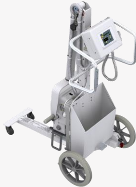
MASCOTE DYNAMIC Analógico ou Digital