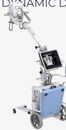
MASCOTE DYNAMIC DT