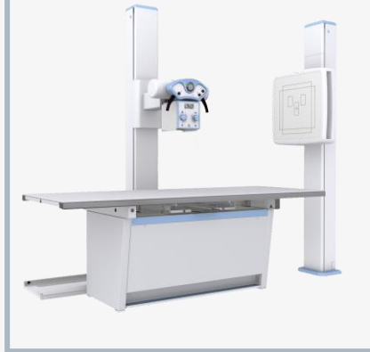
DIAFIX DYNAMIC Analógico ou Digital