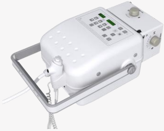
CAPO Analógico ou Digital