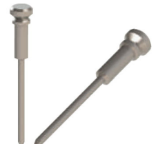
Pino de Ancoragem EFFC . PA01