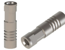
Luva Pino de Ancoragem EFFC . LP01