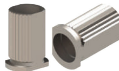
Anilha para Guia Cirúrgica EFFC . AC07 + Ø2.80mm, altura 6x5.50mm