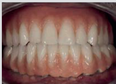
Próteses implantossuportadas JUVORA™ PEEK – Um “novo” material de estrutura para tratamentos protéticos sem metal Siewert B, Rieger H (2013)