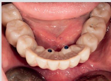
Próteses implantossuportadas JUVORA™ Produção de pontes em PEEK sobre implantes a partir de discos PEEK Siewert B (2014)