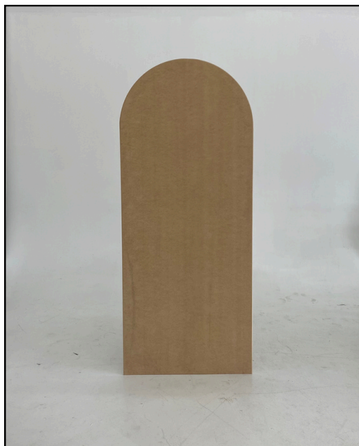
BLS 201.125 / 30L-72H Location 125$.

N'hésitez pas à nous contacter pour plus d'informations ou pour toute demande spécifique. Nous sommes là pour vous fournir un service personnalisé et répondre à vos besoins en matière d'équipement événementiel.