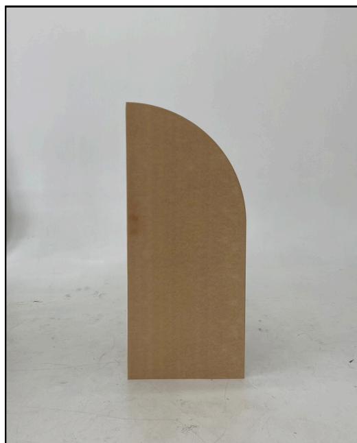
BLS 203.100 / 24L-60H Location 100$.