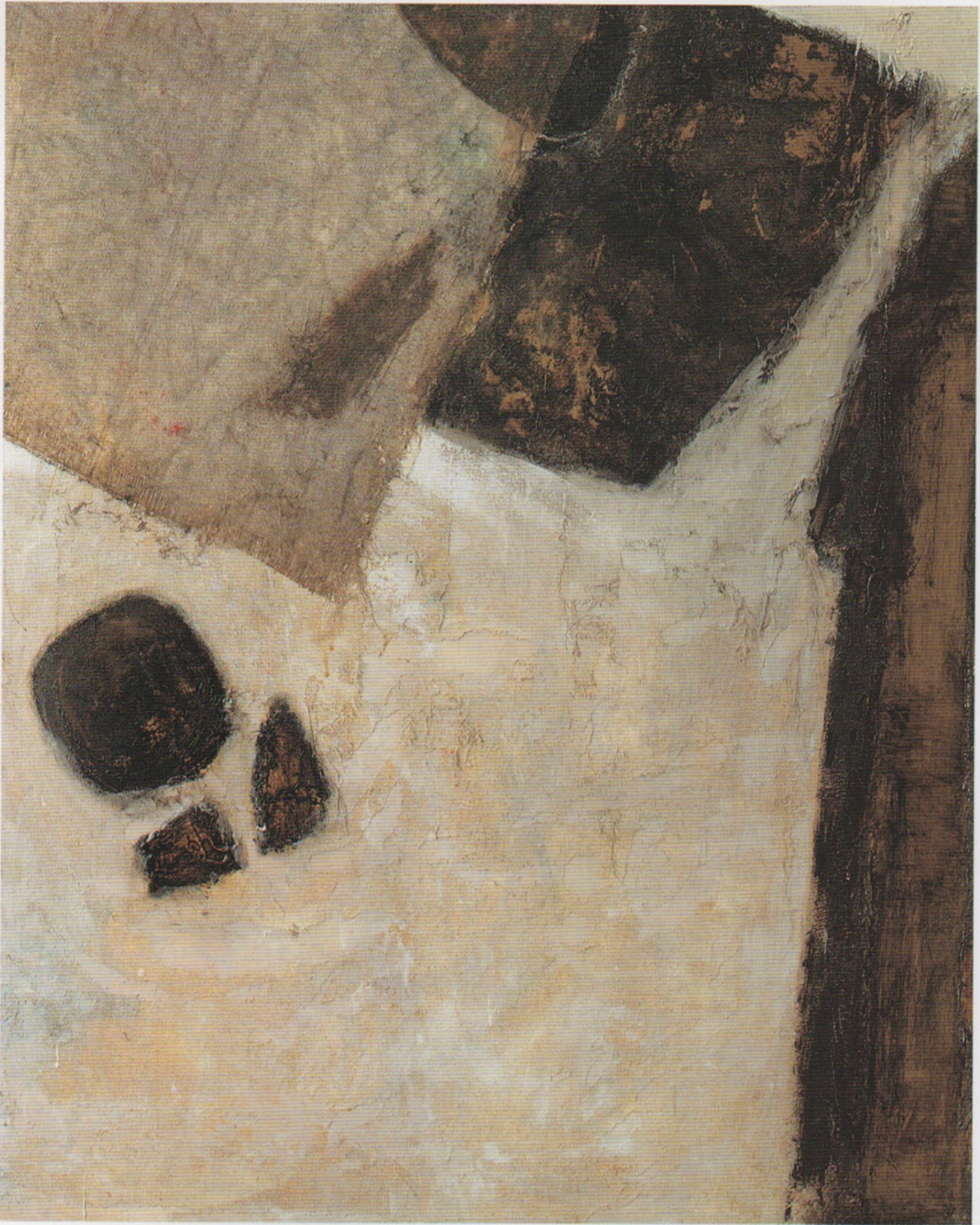
“POZO DÚ-LCE” Oleo y Trama sobre tabla