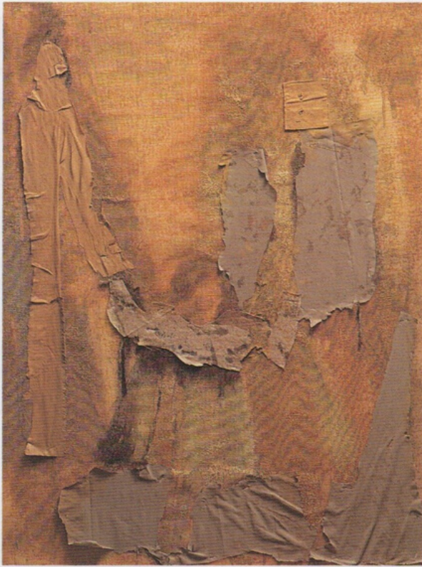
"PASEO" Oleo y Trama sobre tabla