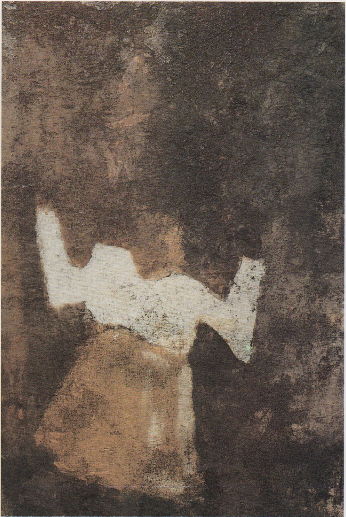
“NIÑA” Técnica mixta sobre tela