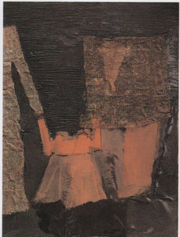
"EN RESUMEN" Oleo y Tramas sobre papel y tabla