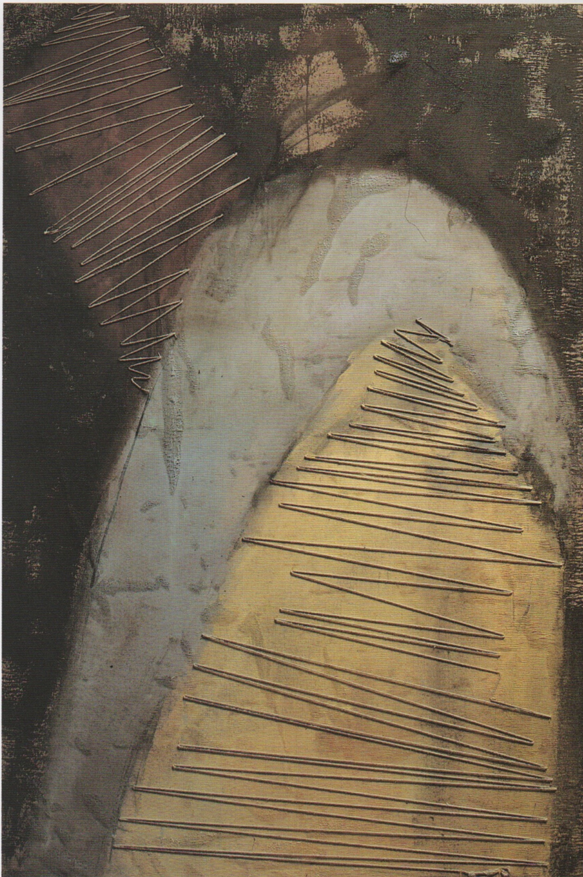
“CAPA-LANDA” Técnica mixta sobre tabla