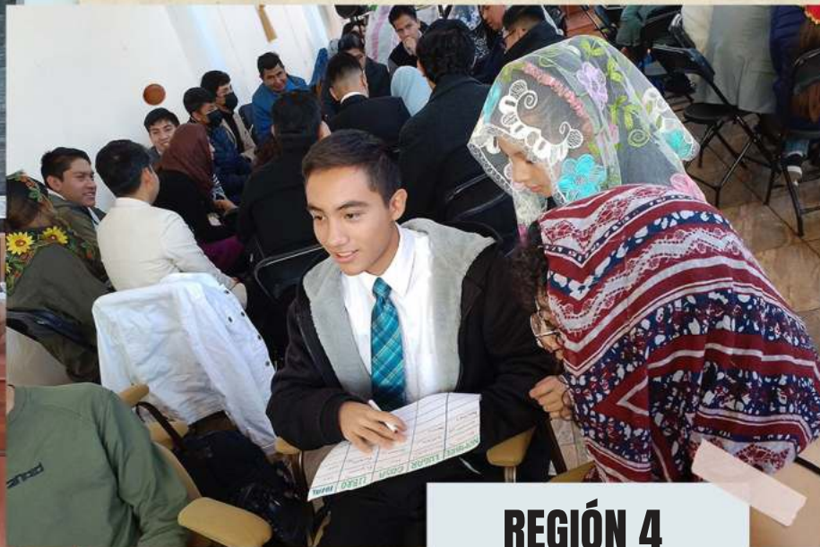
REGIÓN 4 CULTO DE REFLEXIÓN DE BAUTISMO "¿Qué impide que sea yo bautizado?" (Hechos 8:36) 4 de febrero 2023 ACTOPAN, HGO.