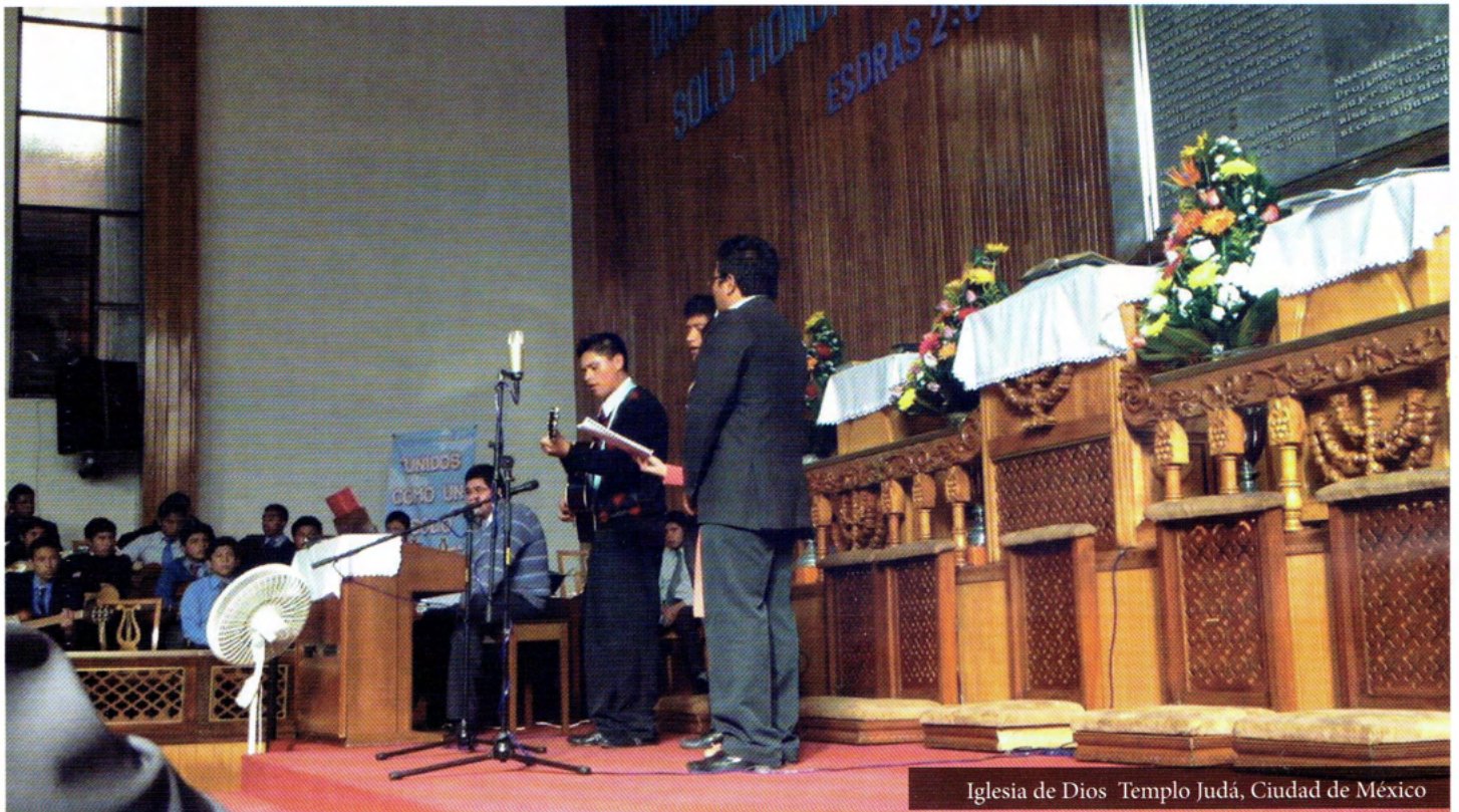
Iglesia de Dios Templo Judá, Ciudad de México