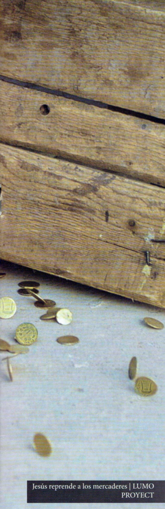
Jesús reprende a los mercaderes | LUMO PROYECT