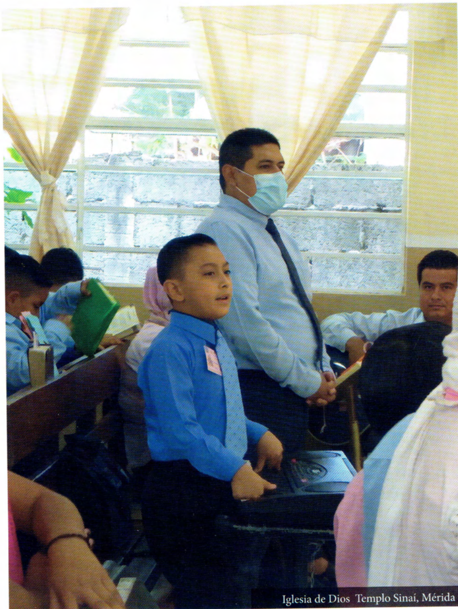
Iglesia de Dios Templo Sinaí, Mérida

Nuestra familia observa que vivimos dichosos siendo parte de la Iglesia de Dios, que nos sentimos afortunados por pertenecer a este hermoso pueblo, que cada miembro tiene un valor incalculable , que es una grande alegría poder pertenecer a un pueblo especial 1ª Pedro 2:9, evitando