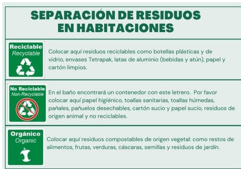
Figura 3. ¿Cómo separar los residuos?