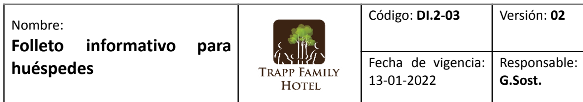
Tabla de contenidos