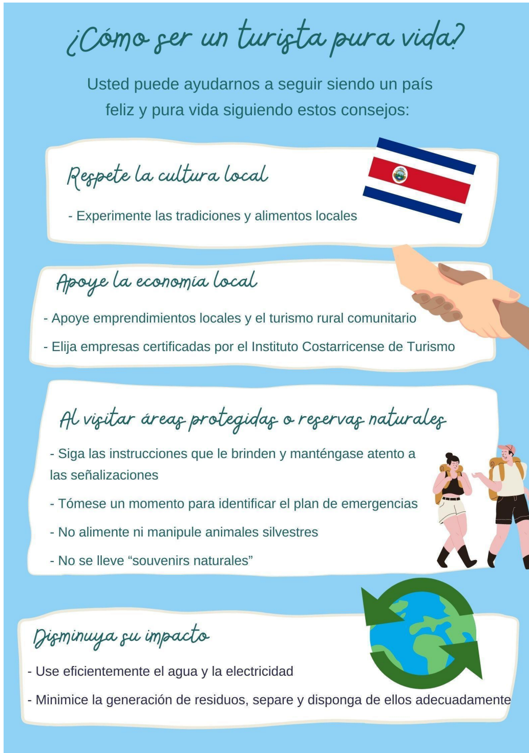
Figura 2. ¿Cómo ser un turista pura vida?