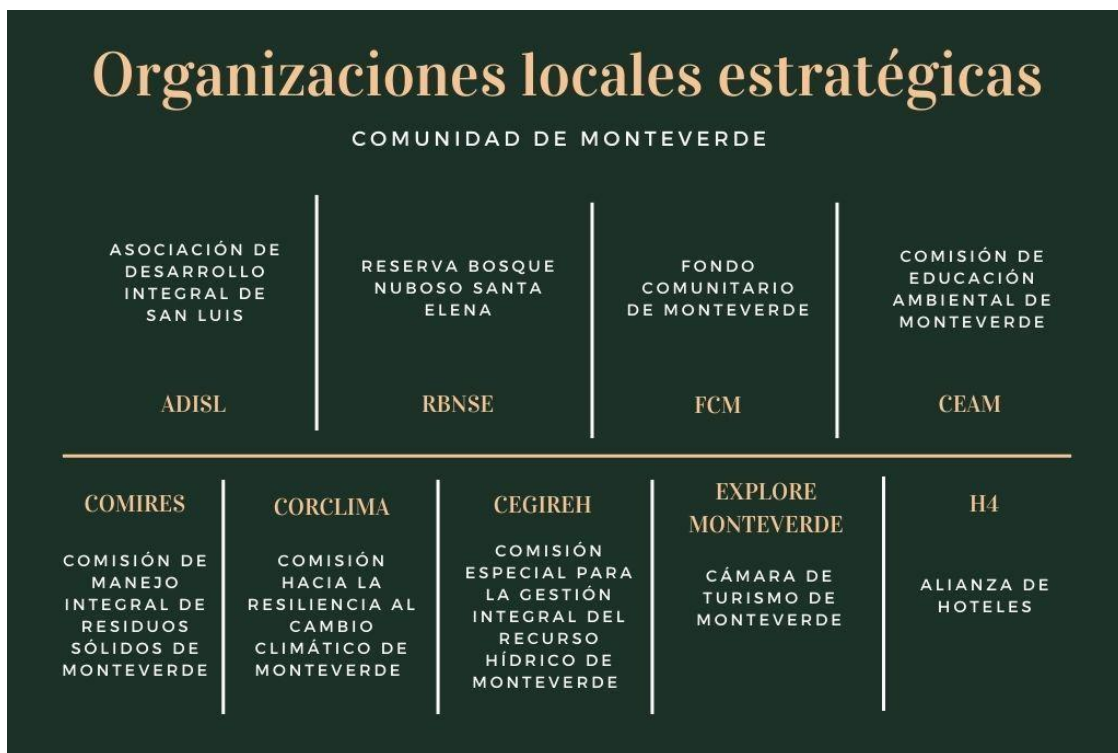
Figura 5. Política de ética contra la explotación sexual comercial de niñas, niños y adolescentes

Monteverde se caracteriza por tener una gran cantidad de organizaciones que trabajan para beneficiar diferentes aspectos de la comunidad. A continuación, se describen las principales organizaciones locales estratégicas.