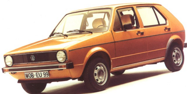
VW GOLF 初版高尔夫

第二，”形式服从功能“是19世纪美国建筑师沙利文的名句，也是20世纪后期被非议最多的设计原则。但是我认为，至少在机器设计领域，它还是至理名言。直到今天，很多功能主义的造型依然是公认的美观，比如协和式飞机，艾菲尔塔等等。在20世纪末曾经有一段时间，设计界似乎推翻了这条3F原则。年轻设计师奉行了与之对立的所谓“形式服从快乐”的新3F，FORM FOLLOWS FUN，一时间设计领域里无所不可，离经叛道成为时髦。但是小聪明终究不能抗拒大智慧，快乐原则不久烟消云散。