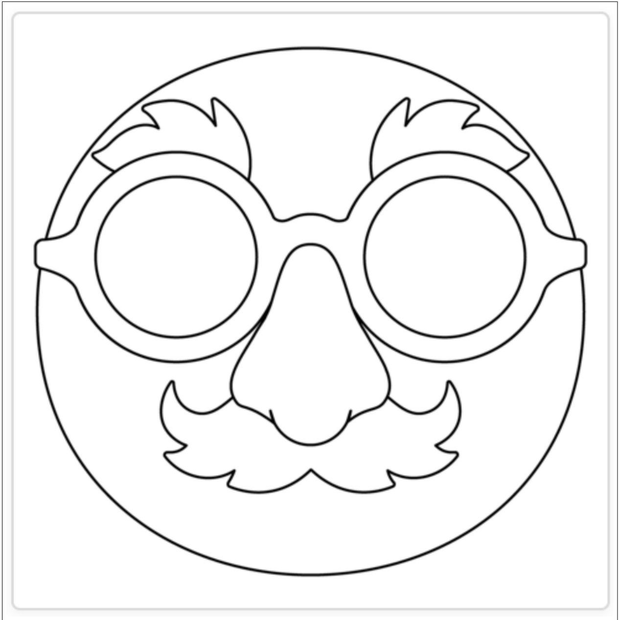
Figura 2: Disguised Face Emoji , by Google

Permission: Free for personal, educational, editorial or commercial use. This work is licensed under a Creative Commons Attribution 4.0 License. Attribution is required in case of distribution.