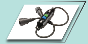
RCD ऑन-बोर्ड चार्जर