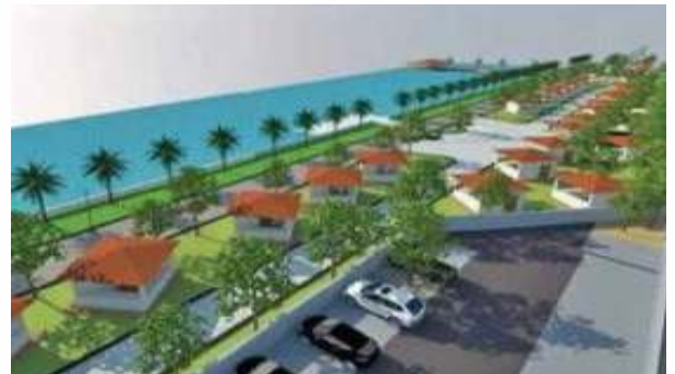
வாகன நிறுத்த வசதியுடன் அழகாக்கப்படும் வண்டியூர் கண்மாய்