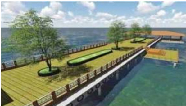
வண்டியூர் கண்மாயின் மையத்தில் அமையும் சிறிய தீவு

மதுரை வண்டியூர் கண்மாயை மேம்படுத்தி அங்கு முன்பு இருந்த பூங்கா மற்றும் வண்டியூர் கண்மாயை ரூ.99 கோடியில் ரூரிஸ்ட் ஸ்பாட்திட்டத்தின் கீழ் மேம்படுத்தி சிறந்த பொழுதுபோக்கு இடமாக மாற்ற பணிகள் முடிவறும் தருவாயில் உள்ளது. விரைவில் இப்பூங்கா மக்கள் பயன்பாட்டுக்கு வரும்.