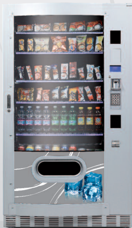
Skudo Max 1050