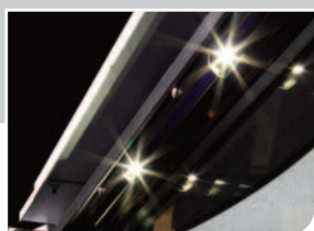
Illuminazione interna con Power LED laterali e superiori