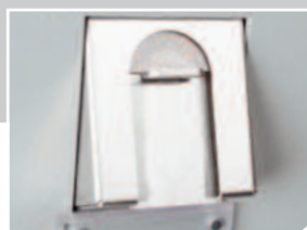
Inserimento monete antivandalico