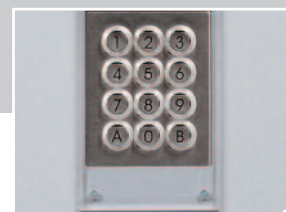
Tastiera protetta da lexan 5 mm