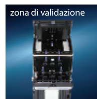
zona di validazione

Con i lettori di banconote currenza la vostra operatività sarà più affidabile e redditizia.