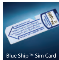
Blue Ship™ Sim Card