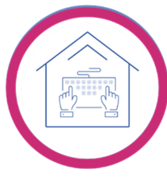
Trabajo desde casa

Tus colaboradores seleccionan la modalidad en la que se encuentren laborando, e iniciará la evaluación correspondiente a través de su dispositivo móvil o web