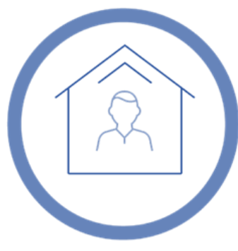
Permanezco en casa, pero no trabajando