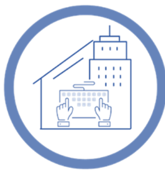
Combino entre mi casa y mi centro de trabajo