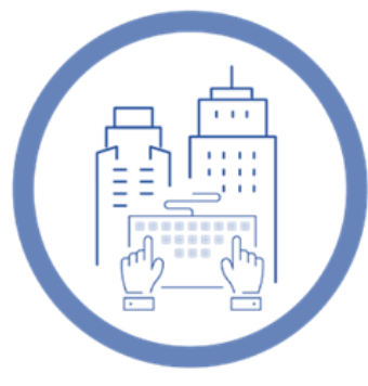
Trabajo en mi lugar habitual