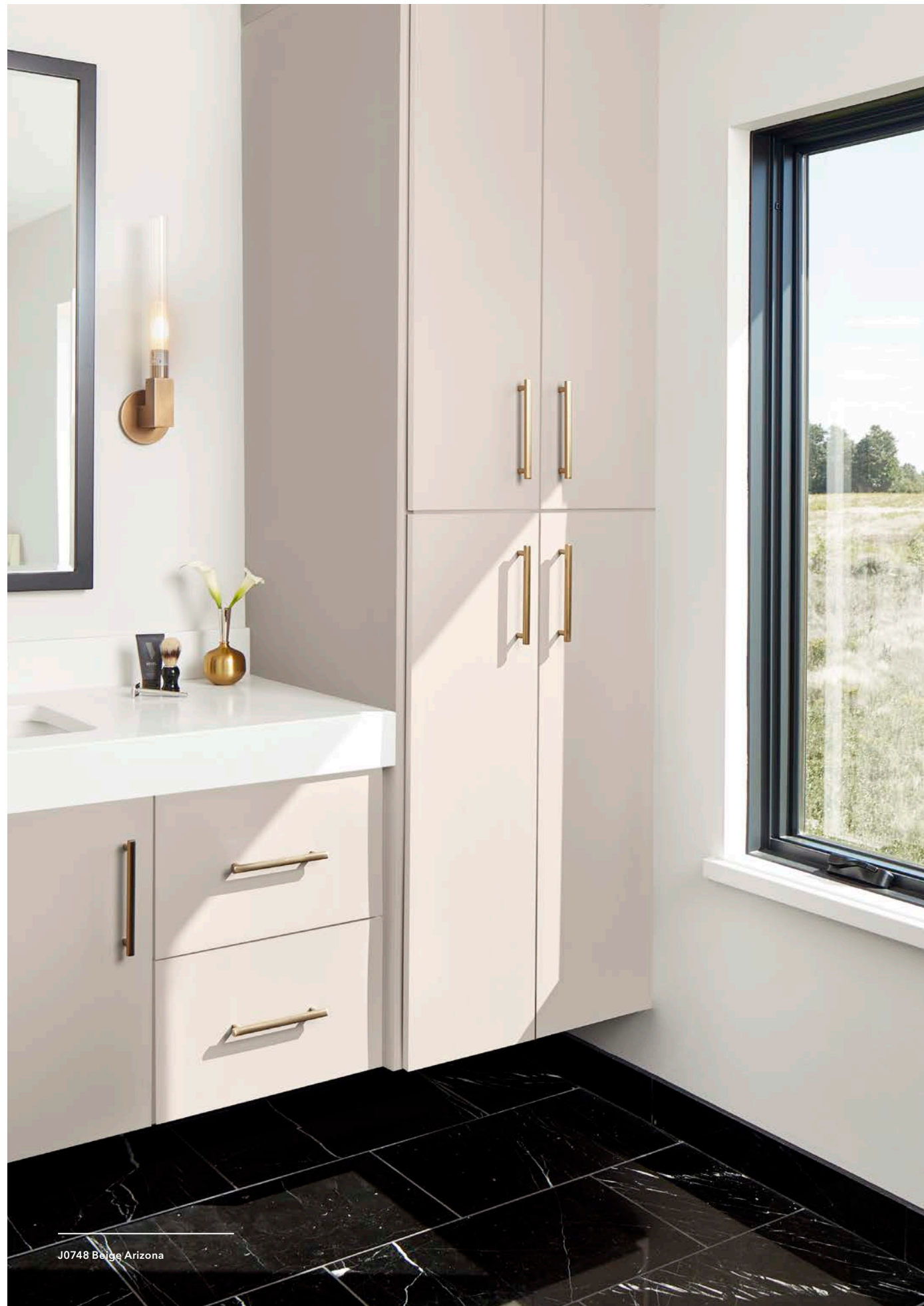
J0748 Beige Arizona