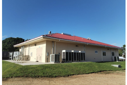
Hospital Regional Materno de Puerto Limpira Tipo de Cable: THHN/THWN