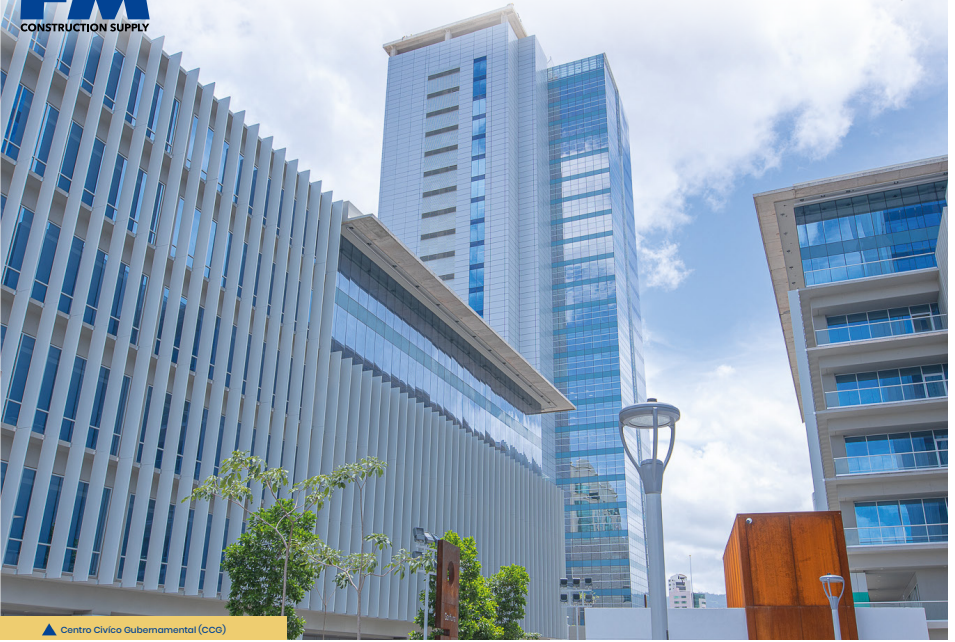
▲ Centro Cívico Gubernamental (CCG)