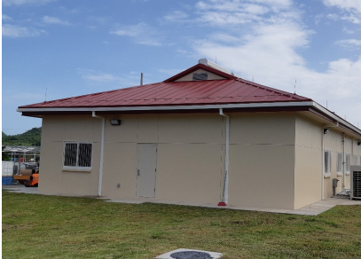
Emergency Operation Center / Disaster Relief Warehouse, San Lorenzo, Valle Tipo de Cable: THHN/THWN