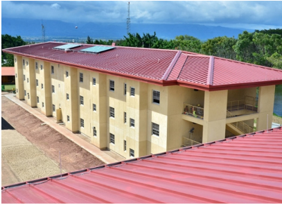
Barracks FY-19, Base Soto Cano Tipo de Cable: THHN/THWN / XLPE CU