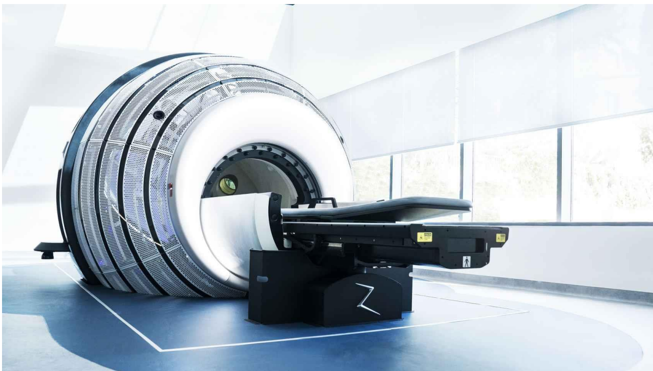
A máquina ZAP-X, um sistema inovador de radiocirurgia. Hospital Clínico da Universidade de São Carlos IRCA

R.: São apenas 10 no mundo – Estados Unidos, Alemanha, Suíça e Espanha. O quarto que foi ativado na Europa foi o nosso, tornando o Instituto de Radiocirurgia Avançada (IRCA), do Hospital Viamed Santa Elena de Madri, o primeiro e único centro que possui esse sistema em nosso país. E é também a que está a tratar os tumores mais complicados e com maior sucesso. Agora também estão sendo instalados na França, Polônia, Grécia... porque é evidente que funciona.