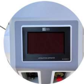
Dijital dokunmatik ekran 7 inch