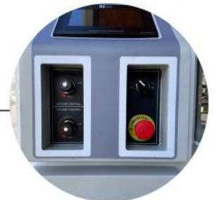
Manuel hassas hacim ve akış kontrolü