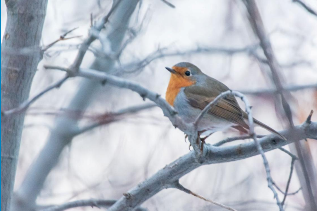
Rougegorge familier de Montréal

Bienvenue à un grand voyageur et Code d'éthique en Ornithologie.