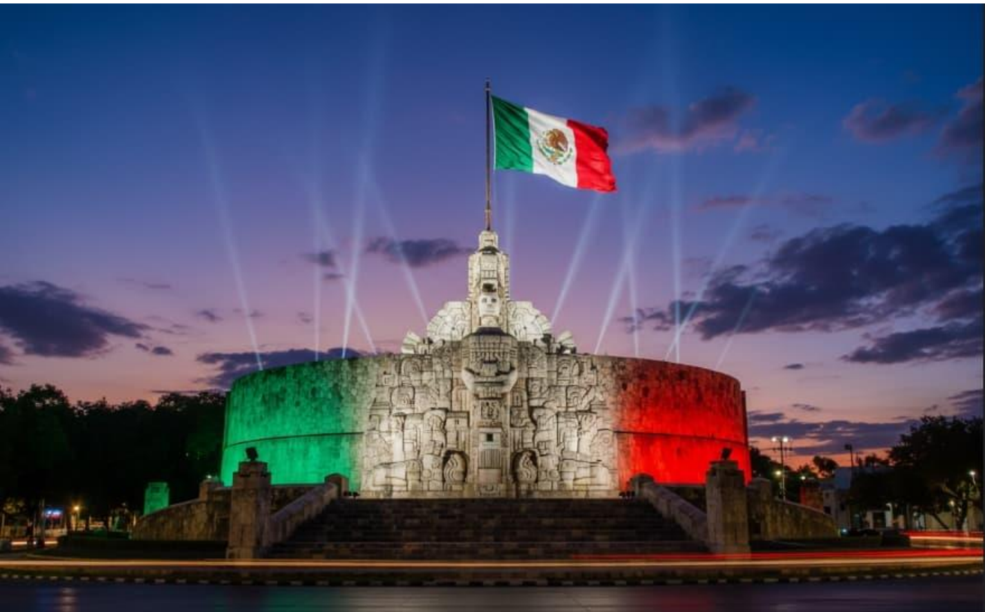
MONUMENTO A LA PATRIA