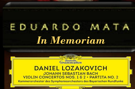
EDUARDO MATA In Memoriam