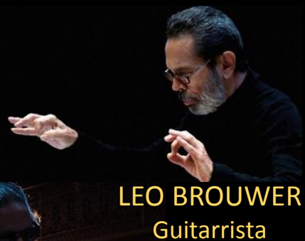
LEO BROUWER Guitarrista