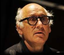
MICHAEL NYMAN Compositor