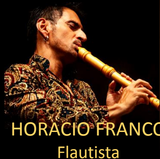
HORACIO FRANCO Flautista