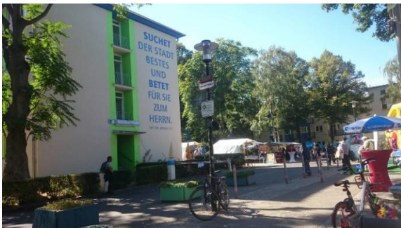
ภาพที่ 5 ทางเข้า Jugendgästehaus จะมีหลายๆ ตึกด้วยกัน พอเดินเข้าไปแล้ว ให้เดินไปทางขวามือ