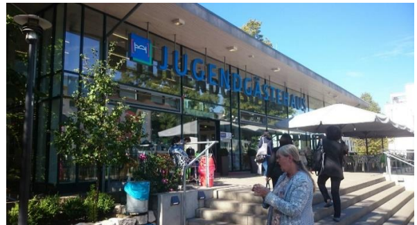
ภาพที่ 6 จะพบอาคารสำหรับติดต่อห้องพัก