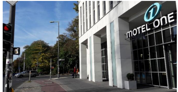
ภาพที่ 4 โรงแรม Motel one พอเดินสุดตัวตึก จะเจอทางแยกขวา คือถนน Lehrter StraÙe ให้ไปทิศนี้