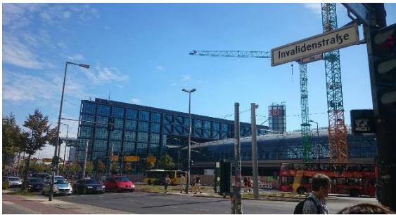
ภาพที่ 3 อาคารสถานีรถไฟด้านหน้าและถนน Invaliden ที่วิ่งผ่านสถานี มองจากฝั่ง Motel one

ค. ท่านจะเจออีกสี่แยก ขอให้เลี้ยวขวาไปตามถนน Lehrter StraÙe ( ดูภาพที่ 1 ประกอบ ) และเดินไปอีกราว ไม่เกิน 100 เมตร จะเจอทางเข้า Jugendgästehaus เลขที่ 68 จะอยู่ ทางซ้ายมือ ( ภาพที่ 1 และ 5 ) ท่านจะใช้เวลาเดินทั้งหมดราว 5 – 7 นาที ขอให้เดินเข้าไปและเลี้ยวไปตามทางเดินขวามืออีกราว 50 เมตร จะเจออาคารสำหรับติดต่อห้องพัก ( ภาพที่ 1 และ 6 )