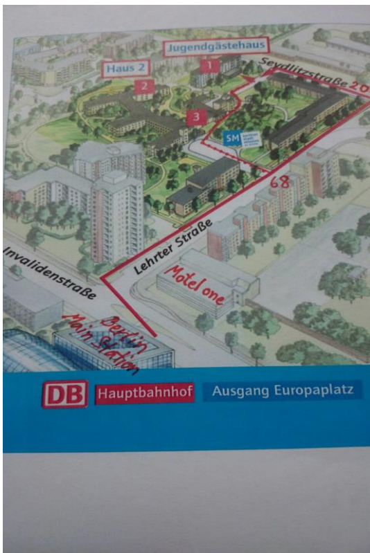
ภาพที่ 1 ภาพสามมิติ แสดงเส้นทางจากสถานีรถไฟกลาง ไปสถานที่จัดประชุม Jugendgästehaus ใช้เวลาเดิน ประมาณ 5 - 7 นาที

1.2 รถแท็กซี่ ท่านสามารถนั่งรถแท็กซี่ตรงไปยังสถานที่จัดประชุมและที่พัก ที่ Jugendgästehaus ที่ถนน Lehrter Straße 68, 10557 Berlin ใช้เวลา 15 - 20 นาที (ระยะทาง 7.5 ก.ม.) โดยสังเกตป้ายที่ขึ้นบอกทางออกไปที่คิวรถแท็กซี่ ซึ่งจะมีค่าใช้จ่ายประมาณ 20 - 25 ยูโร