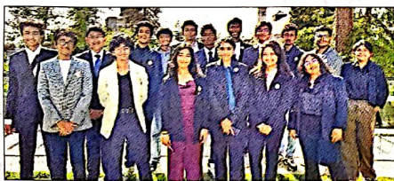
అమెరికాలోని విశ్వవిద్యాలయాలకు వెళ్లిన విద్యార్థుల బృందం

వ్యవసాయ రుణాలు అందక.. అధిక వడ్డీలకు అప్పులు చేసి ఆర్థికంగా చితికిపోతున్న రైతులకు అండగా నిలిచేందుకు తన వంతు ప్రయత్నం చేస్తున్నాడు ఆ విద్యార్థి. ఒకటైపు చదువుకుంటూనే.. మరో వైపు ఖాళీ సమయంలో కర్షకుల కోసం ఏదైనా చేయాలని ఆరాటపడు తున్నాడు. ఐక్యరాజ్యసమితి 1ఎం1బి ప్రాజెక్టులో భాగంగా వినూత్న ఆలోచనలకు ఆహ్వానం పలకగా.. అతని ఆలోచన కూడా ఎంపికైంది. ప్రస్తుతం తన ఆలోచనను కార్యరూపంలోకి తీసుకొచ్చే పనిలో ఉన్నాడు.