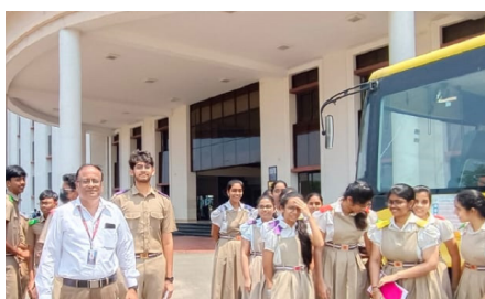
VIT AP VISIT