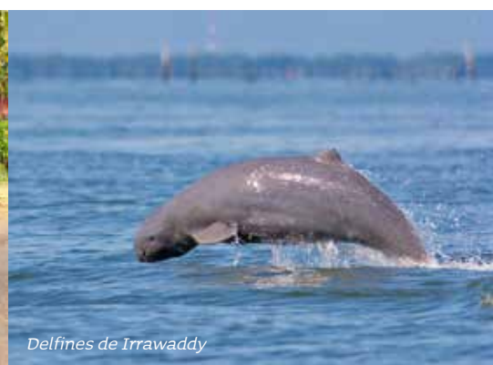
Delfines de Irrawaddy