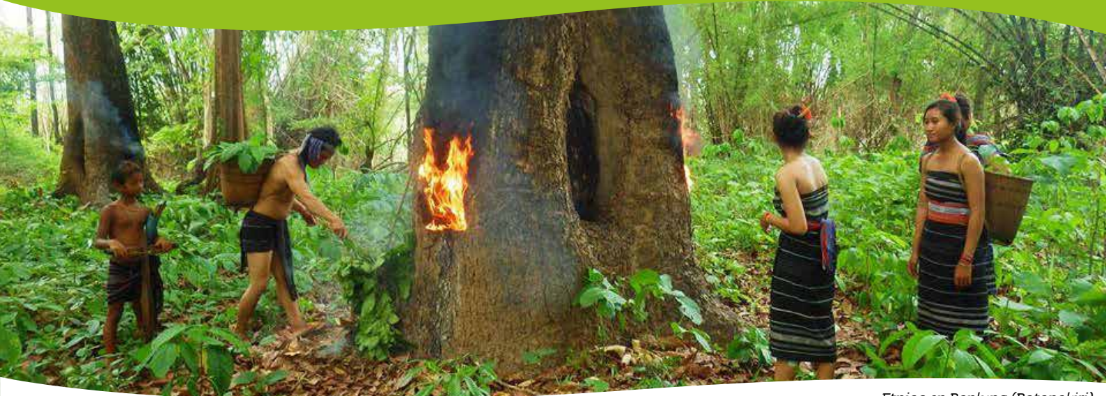
Etnias en Banlung (Ratanakiri)

Ratanakiri , una apartada provincia de gran belleza natural que sirve de hogar a todo un mosaico de minorías étnicas ( jarai, tompuon, brau y kreung ), cada una con su propia lengua, tradiciones y costumbres.