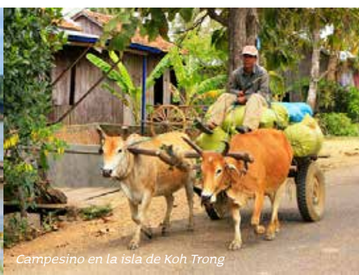
Campesino en la isla de Koh Trong