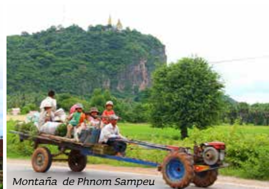
Montaña de Phnom Sampeu