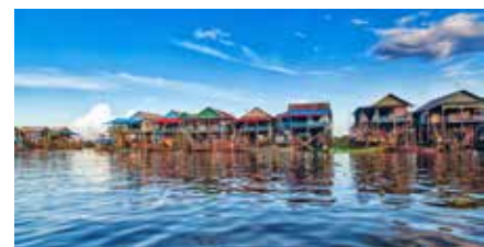
Aldea sobre palafitos de Kampong Phluk.