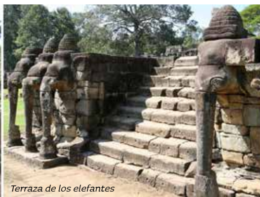
Terraza de los elefantes