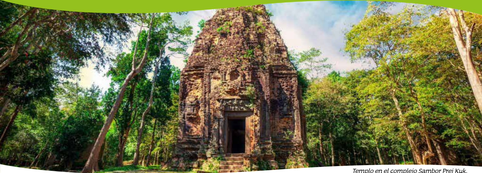
Templo en el complejo Sambor Prei Kuk.

El templo de Sambor Prei Kuk , declarado Patrimonio de la Humanidad por la UNESCO en 2017, es el complejo de templos preangkorianos más importante del mundo y uno de los lugares clave para entender los orígenes de la civilización jemer. Situado en una tranquila zona boscosa de Kampong Thom, fue la antigua capital del Imperio Chenla en el siglo VII y conserva más de un centenar de santuarios repartidos entre tres conjuntos principales. Sus torres de ladrillo, algunas con relieves muy finos y formas arquitectónicas únicas como los templos octogonales, se integran de manera armoniosa en el entorno natural. Pasear entre los templos, envueltos por la sombra de grandes árboles y el silencio del bosque, convierte la visita en una experiencia serena y auténtica. Los alrededores, salpicados de aldeas tradicionales y caminos rurales, completan el encanto de este enclave donde la historia y la vida cotidiana siguen avanzando al mismo ritmo pausado.