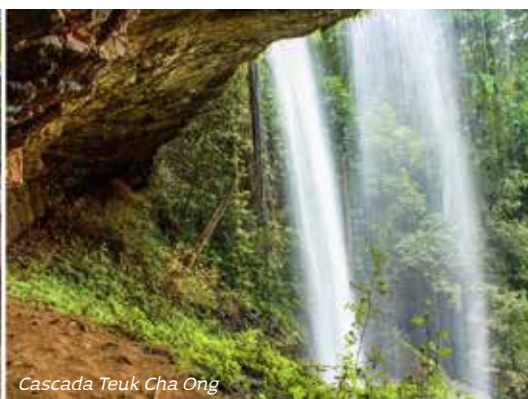
Cascada Teuk Cha Ong