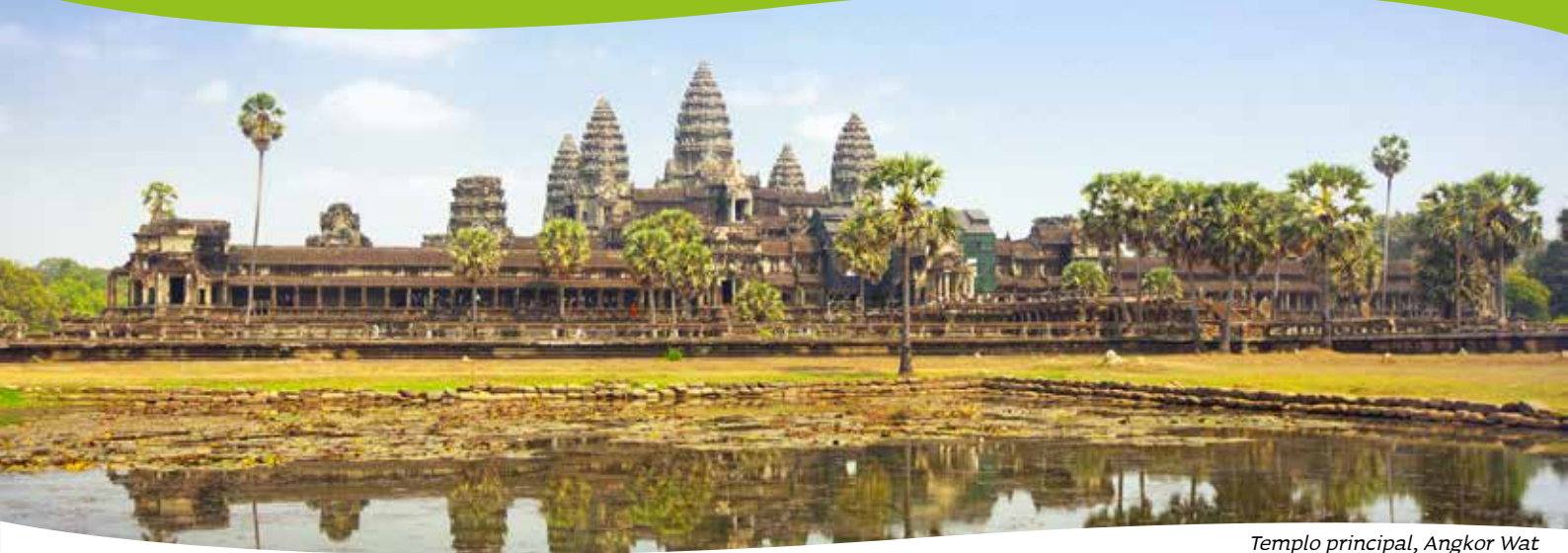
Templo principal, Angkor Wat