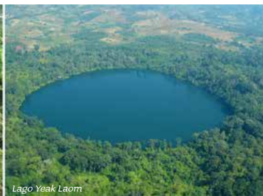
Lago Yeak Laom