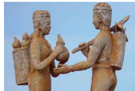
Imagen representativa de mujer de una etnia en Ratanakiri dando agua a su marido después del trabajo.