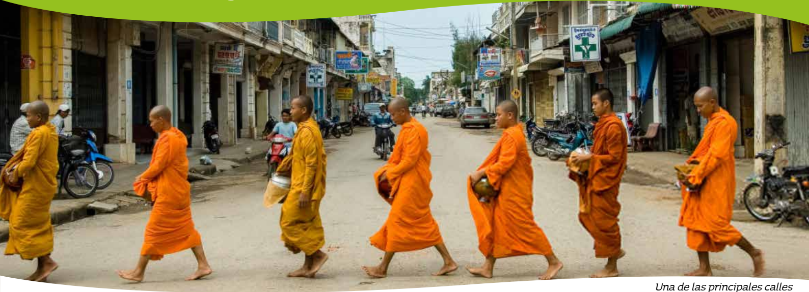
Una de las principales calles de Battambang.

Battambang es la segunda ciudad más grande de Camboya, con una población de más de 255.000 habitantes. Fundada en el siglo XI por el Imperio Khmer, Battambang es conocida por ser la principal productora de arroz de las provincias del país. Durante más de 500 años fue el principal centro comercial de las provincias orientales de Siam, a pesar de que estaba poblada por los khmeres siempre con una mezcla de personas de origen vietnamita, laosiano, tailandés y chino.