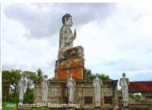
Wat Phnom Ek - Battambang