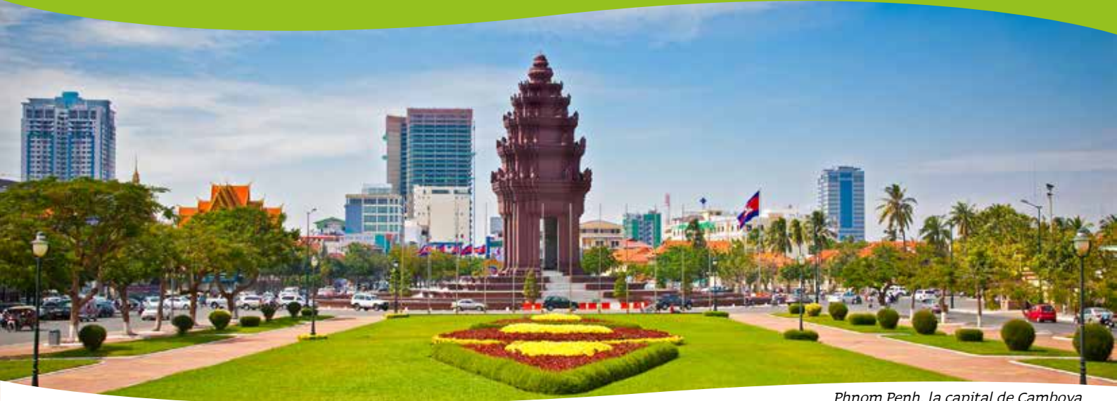
Phnom Penh, la capital de Camboya

Phnom Penh , capital de Camboya y primer centro urbano del país desde la colonización francesa. En el área metropolitana viven unos 2,5 millones de habitantes.