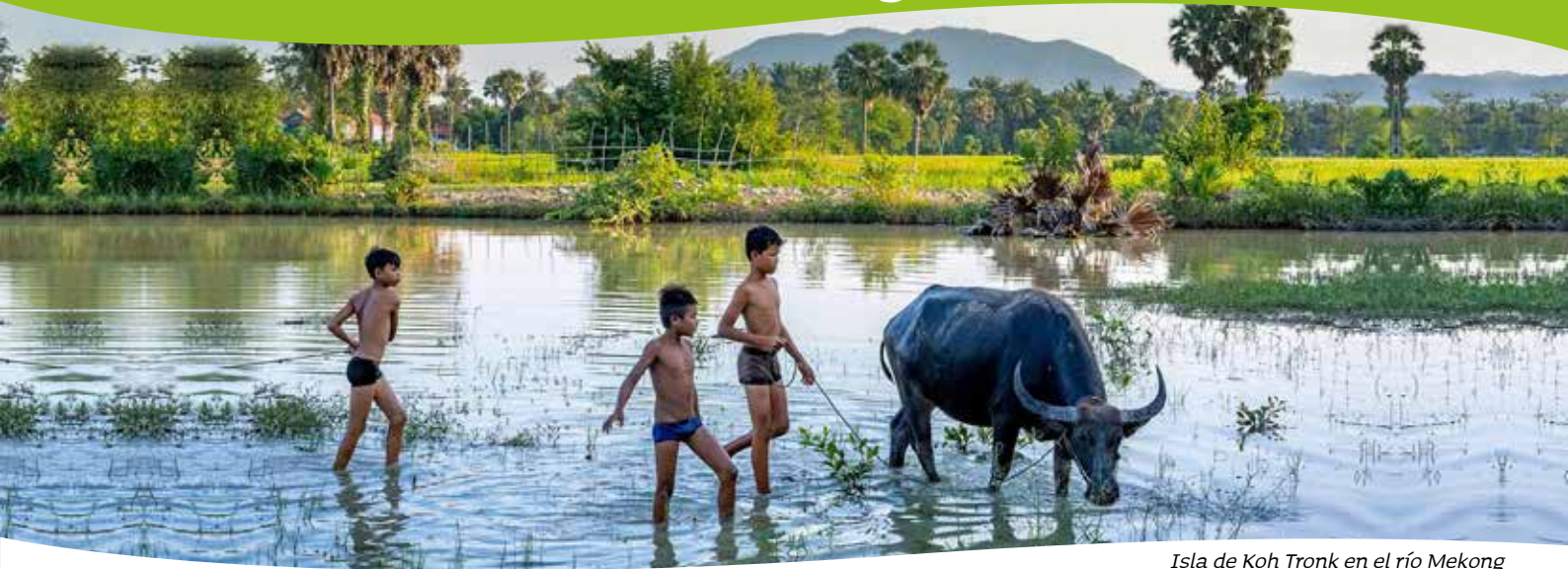
Isla de Koh Trong en el río Mekong

La provincia de Kratie y la isla de Koh Trong representan una Camboya casi detenida en el tiempo, donde aún se conserva el ritmo y el estilo de vida tradicional. En esta región, el río Mekong se ensancha formando numerosas islas con playas fluviales y bancos de arena blanca. En sus aguas habitan los raros y amenazados delfines Irrawaddy, pequeños cetáceos de agua dulce en grave peligro de extinción.