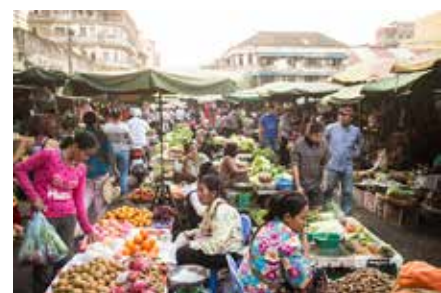
Mercado de Kondal - Phnom Penh