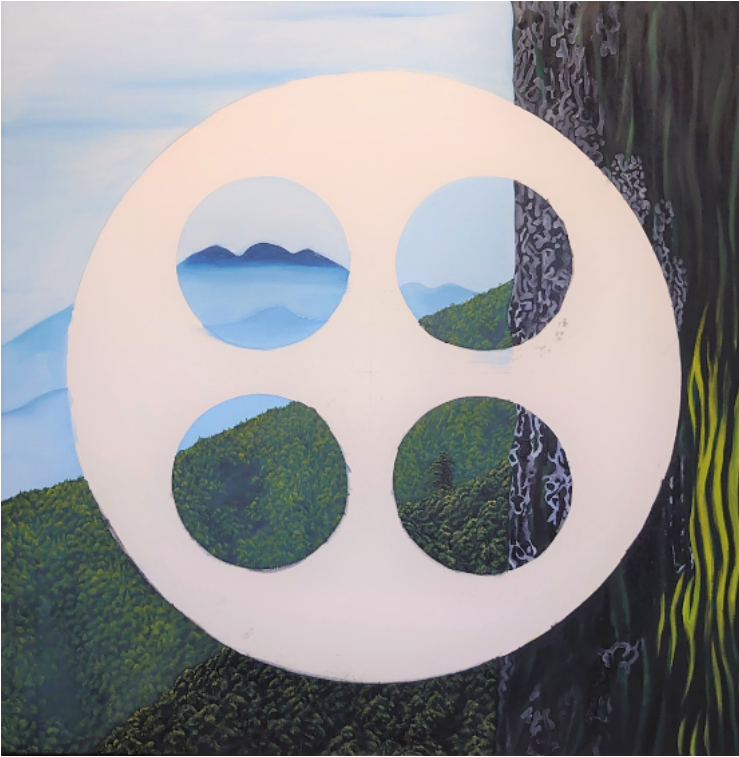
鈕扣的記號-守城大山 2021 畫布油畫 100x100x3cm

宜德思·盧信 (Idas Losin) 為泰雅族 / 太魯閣族藝術家，畢業於國立台北藝術大學美術系，曾多次遠赴澳洲，2013年起陸續走訪復活節島Rapa Nui、夏威夷、關島、紐西蘭、大溪地等，從國外原住民與主流社會之間的關係，反思臺灣原住民藝術與自我樣貌。宜德思以油畫為主要媒材，透過原創色彩、角色形象和議題式的內容，表達一種生命情境的感受與對土地的關懷之情。她曾於2012年獲得Pulima藝術獎首獎、2014 ACC年度獎、2018年受邀參加亞太當代藝術三年展 (Asia Pacific Triennial of Contemporary Art)、2019年舉辦《跳島 幻島 天河-宜德思·盧信個展》，也參與《泛·南·島藝術祭》、《危觀風景》、《島嶼隱身》、《南方》等聯展。