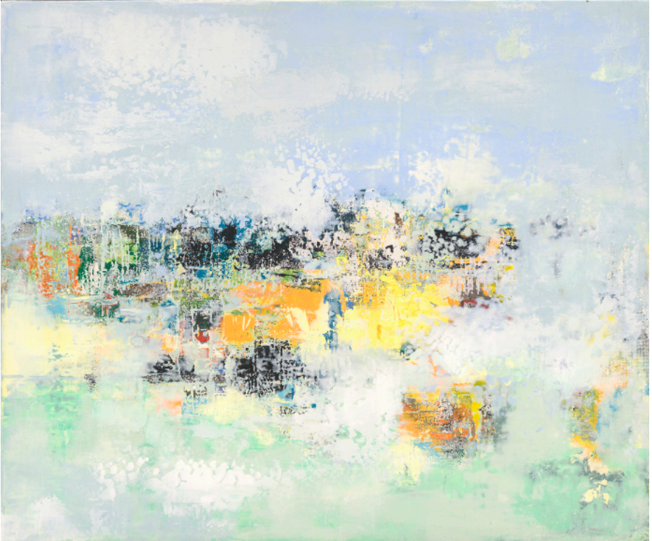
風景23-2, 2023, 複合媒材 60.5x72.5cm

近年融合了版畫與布面繪畫技法的創作者徐明豐，創作素材與靈感主要來自於行旅於大地間的悸動，發展出極具特色的繪畫風格。透過無數的打磨與堆疊，將藝術家眼中的景致與感受到的情感，進行融合、封印、轉化，徐明豐透過其和煦內斂的色調，帶領著觀者進行一趟暖心之旅。