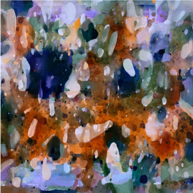
棲地Habitat No.14 2021 油畫 60x60cm

2004畢業於紐約市立大學，2016自台中移居至花蓮。莊臥龍的創作強調一種層次與流動的狀態，猶如自然的流轉與變動。畫面中所營造的片段組成，經常呈現一種互為表裏的結構關係，呈現出空間、時間混雜與交融的狀態。就像是走在山中穿越樹林，穿越並往有光的方向前行，過程中經驗了時光與思緒的交會，而非風景的輪廓樣貌，最終成為獨特的個體與新的體驗。