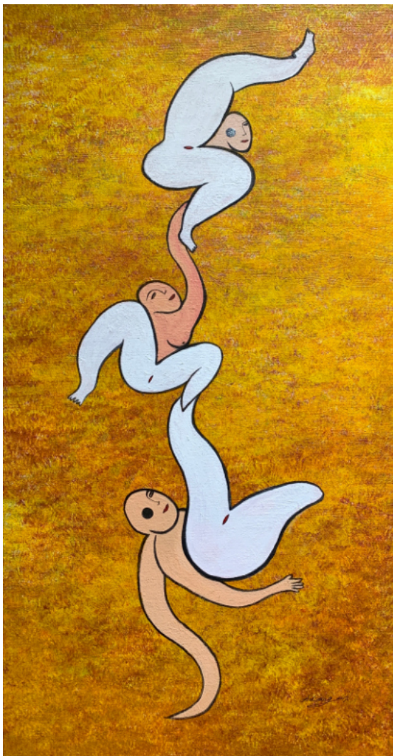
接觸即興 2017 複合媒材 35×71cm

阿緹蓉Adirong是一位自發原創型的創作者，2000年從台北移居到台東，2004年再移居到花蓮...至今不間斷地持續創作。她以極具特色的構圖色彩，真實傳遞內在深沉情感、衝突、幻想、生命的激情與滯在、身而為人的艱難與釋放....等。她的作品呼應著她生命裡每一個階段的歷程與心靈轉變。作品真實動人、線條充滿靈動、個人風格和辨識度強烈。阿緹蓉Adirong在創作中尋找、叩問、平衡著自己與生命，創作出一幅一幅令人感到共鳴與感動的畫作。