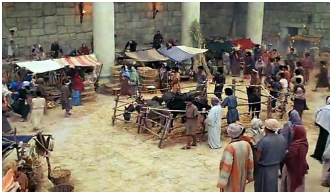
圣殿变成了集市（上图所示为外邦人院区域）