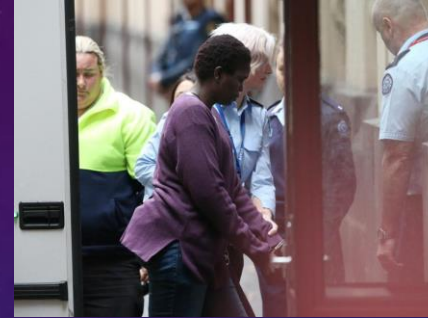
ဧပရယ် ၂၀၁၅ မှာ အကွန် ဂူအတ်က ၄ နှစ် အရွယ်အမျိုးသားများနဲ့ ၁၆ လအရွယ် ကလေးငယ်ကို ကန်ထဲမောင်းချ