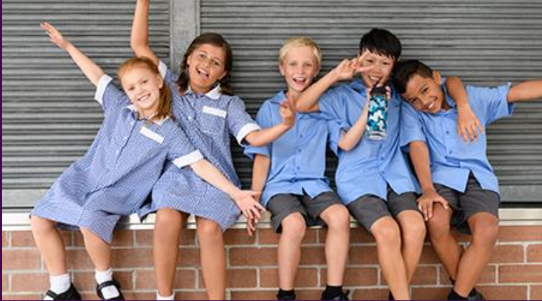
6 – 17 COMPULSORY SCHOOL AGE