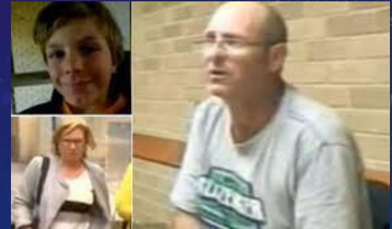
သားငယ် လူ(က်) ကို သတ်ဖြတ်ခဲ့သည့် ဂရက် အန်ဒါဆန် ၊ ဖေဖော်ဝါရီ ၂၀၁၄ ၊ ၁၁