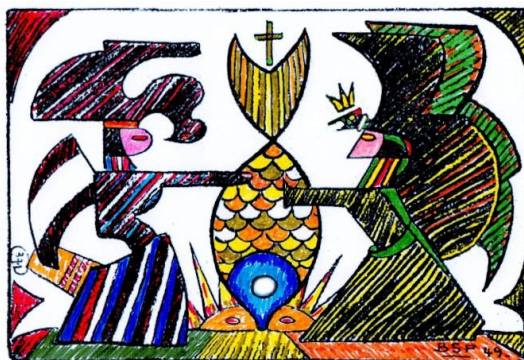
El pez surgirá triunfante en el 2002 (1949) Foro Argentino