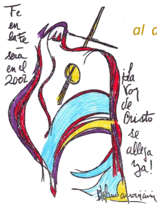
Fe en la Fe será en el 2002 ¡La voz de Cristo se allega ya!

Has de saber, hombre de la Tierra, QUE EL CRISTO ES EL DIOS PRODUCIDO POR TI MISMO . El que germina dentro de tu Ser, al apartarte de las creencias que obnubilan el pensamiento en delirios de ignorancia y fanatismo. El que eres sí Muta tu Interno a la verdadera dimensión del Hombre Universal que sólo se nutre de la Verdad, la Belleza y la Perfección; pues vive y piensa solo dentro de la Ley. El que traes dentro de ti como la Luz y Sapiencia que fluye de tu interior, al dejar las viejas envolturas que sólo traen desolación y ruina, pues este Poder de Dios en el Hombre , no aparece en los cuerpos atiborrados de vicio y suciedad; en los poseídos por sus pasiones, en los reclusos de sus defectos que perpetúan su aflicción por ignorar su propia Esencia Inmortal .