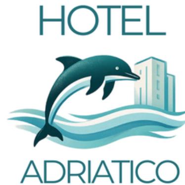
PALETTE DI COLORI